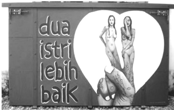
Gambar 4. Gambaran Beristri Dua

Pada gambar 1, terlihat perempuan dengan posisi yang menantang, santai, sensual, memakai pakaian seksi, dan senyum menggoda memberikan pesan kepada penonton yang memandangnya mengenai suatu hal. Terdapat sejumlah petanda yang terdapat dalam gambar tersebut. Tubuh perempuan yang sedang tidur menyamping menghadap ke depan membentuk bidang yang hampir memuat sebagian besar gambar. Pakaian seksi dengan balutan rok mini dan baju minimalis menandakan hasrat menggoda kepada orang yang melihatnya. Senyumnya memperlihatkan ikatan phatik yang dibangun untuk terlibat di dalamnya. Latar gambar pegunungan, pohon rindang, dan dua buah gunung berjajar yang berwarna biru mengisyaratkan adanya keteduhan. Dengan petunjuk etnisitas sebagai gadis Sunda yang geulis dan dipertegas dengan tulisan kutunggu kedatanganmu mengisyaratkan hasrat wanita yang ingin terpenuhi oleh laki-laki.