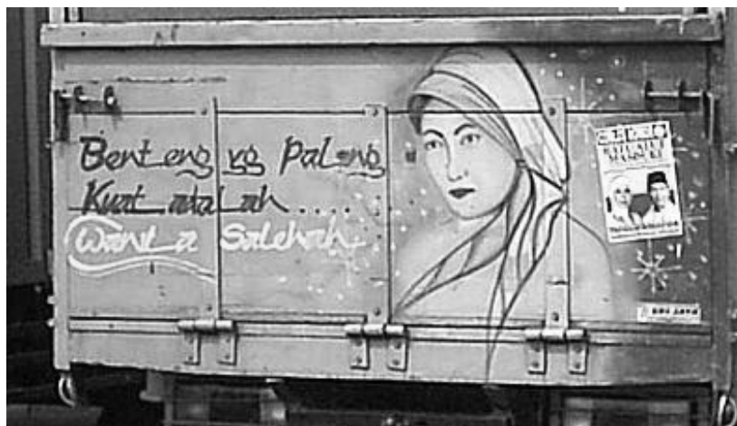
Gambar 6. Ungkapan Perasaan Sopir