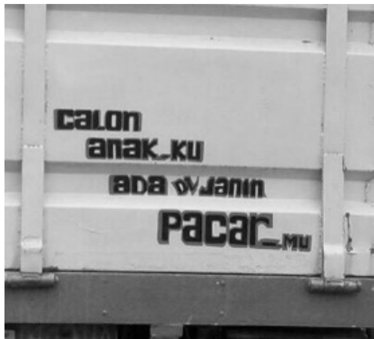
Gambar 9. Calon anakku ada di janin pacar-mu

Implikatur merupakan tuturan yang secara implisit memiliki maksud tertentu. Beberapa data dan implikturnya disajikan pada tabel berikut.