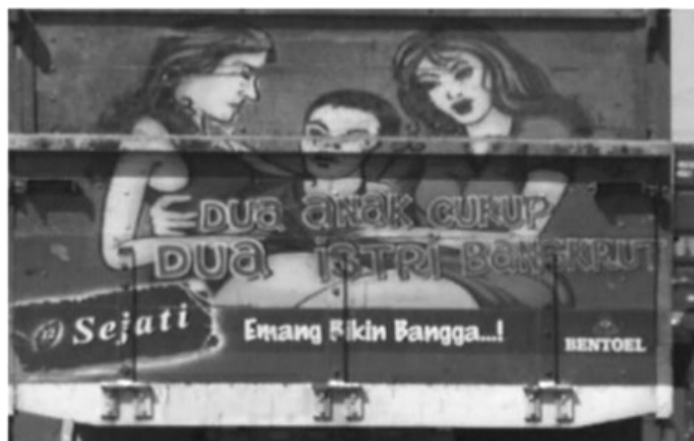
Gambar 3. Gambaran Pria Beristri Dua