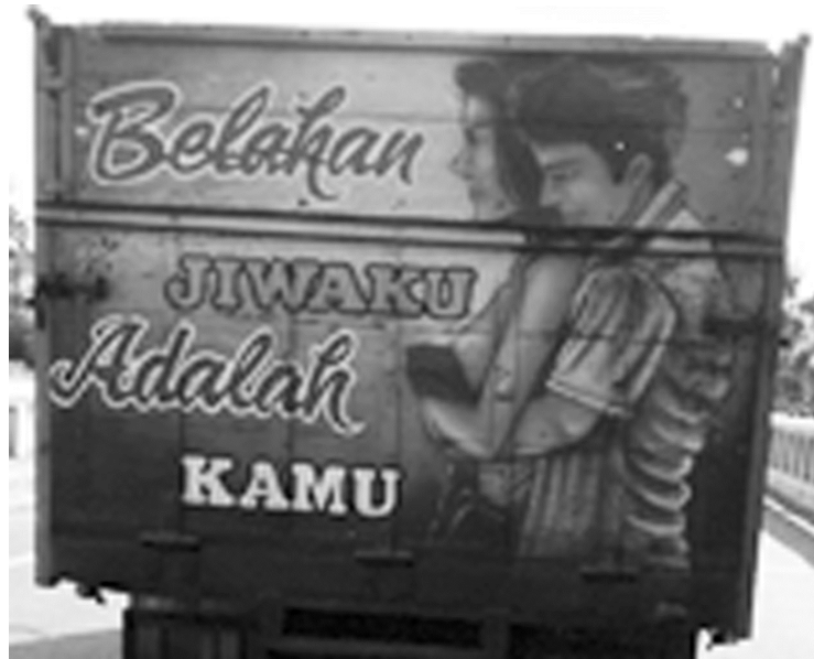
Gambar 5. Ungkapan Perasaan Sopir

ungkapan perasaan dari sopir terhadap perempuan yang dikasihi, yaitu ibu, istri, atau kekasih seperti data berikut.