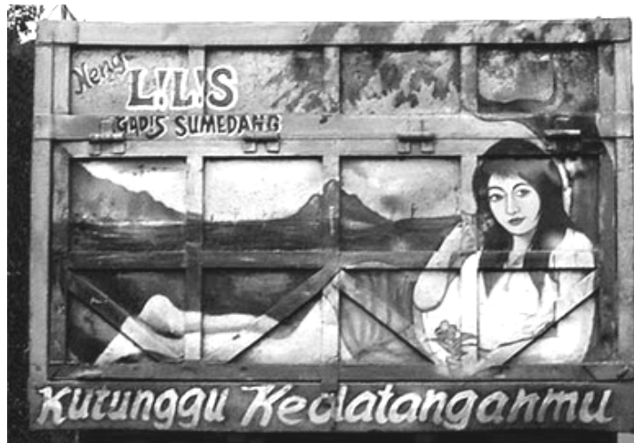
Gambar 1. Sosok Wanita yang Menantikan Kedatangan Seseorang