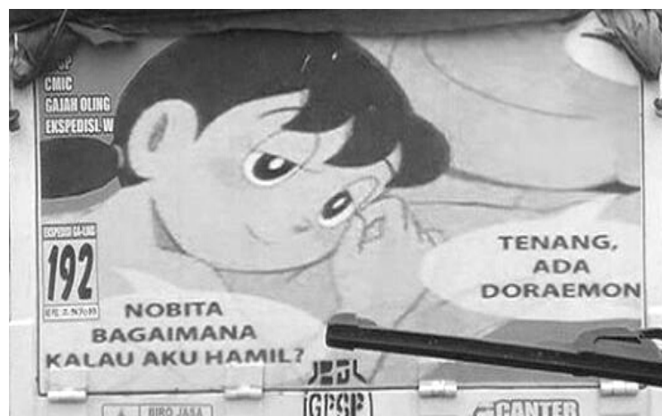
Gambar 11. Implikatur Doraemon

Untuk memahami implikatur, Wang (2011:1162) menjelaskan perlu adanya pemahaman makna dan maksud dari situasi khusus yang digambarkan dalam implikatur dengan melakukan penelaahan aspek di luar kebahasaan. Berdasarkan hal itu, pada gambar 9, implikaturnya adalah aku (laki-laki) melakukan hubungan seksual dengan pacar-mu (perempuan) sampai perempuan itu hamil. Enklitik –mu yang melekat pada kata pacar mengindikasikan bahwa laki-laki tersebut mengenal sosok pacar perempuan yang dihamilinya. Pada gambar 10, laki-laki tampak berdoa agar dilindungi dari godaan wanita, seperti cabe-cabean, para mantan, wanita penghibur, tante girang, janda muda,