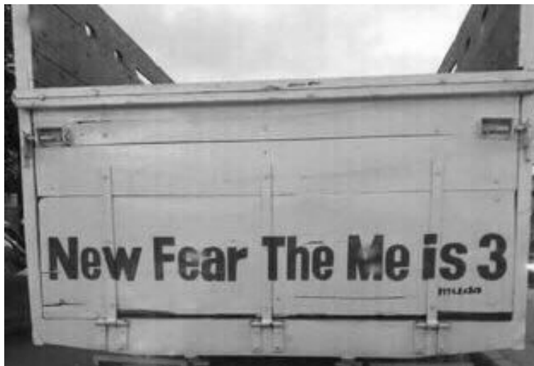
Gambar 7. Tulisan Nyupir demi Istri

Temuan jenis ini tampak pada data berikut.