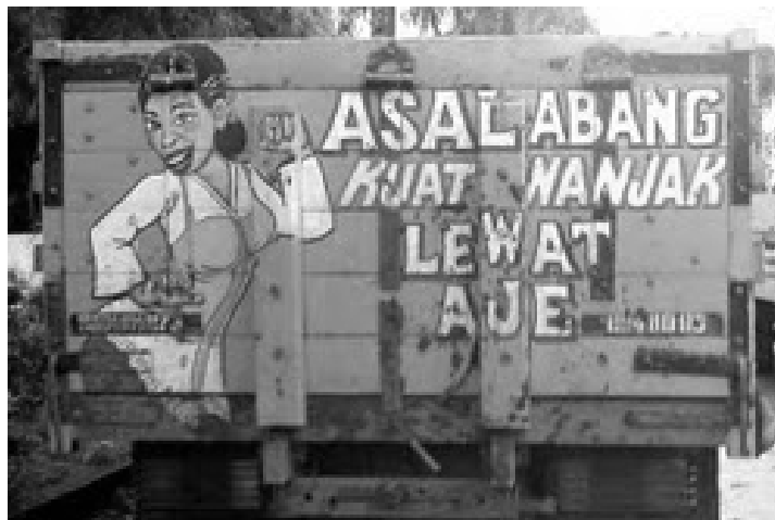
Gambar 2. Seorang Perempuan yang Menantang Laki-Laki