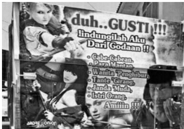
Gambar 10. Doa Supir