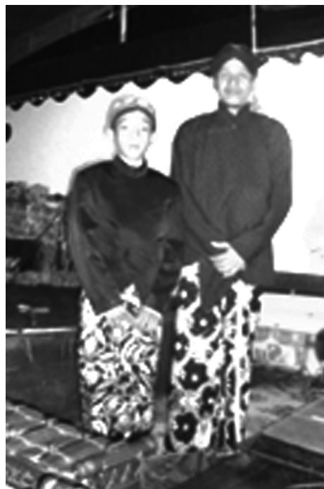
Gambar 2. Cotoh ukuran fisik dalang usia anak (kiri) dan dewasa (kanan).