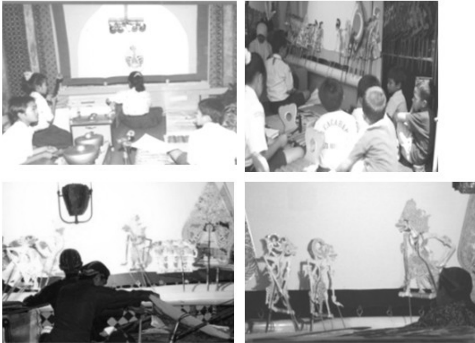
Gambar 1. Contoh boneka wayang multi level untuk dalang multi level usia, yaitu level anak (kiri), level remaja (kedua dari kiri), level muda (ketiga dari kiri), dan level dewasa atau tua (kanan) (Foto: Junaidi, 2006, 2013, 2014, dan 2015).