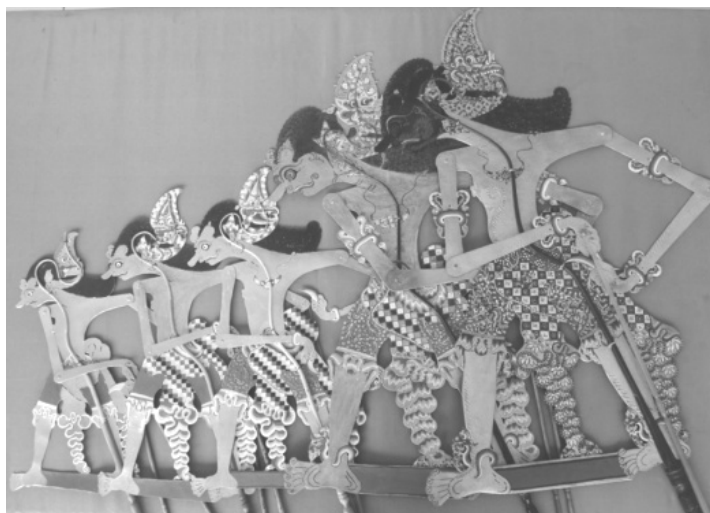
Gambar 3. Wujud wayang berbagai model untuk dalang anak-anak (kiri), anak (kedua dari kiri), remaja awal (ketiga dari kiri), remaja akhir (keempat dari kiri), dan dewasa (kanan).