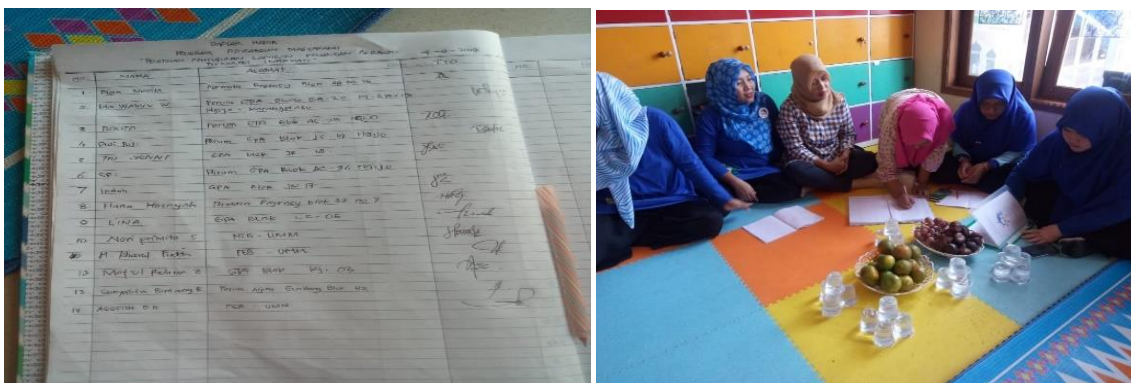
Gambar 1. Tahapan Pertama Observasi Dasar

Tahapan pertama, dalam program pendampingan ini yang dilakukan adalah melakukan beberapa observasi dasar mengenai kebutuhan dasar tentang kebutuhan apa saja yang dibutuhkan dalam pembuatan dan penyusunan laporan keuangan apa saja dibutuhkan oleh PAUD Cita Sakinah, karena tujuan dari kegiatan ini adalah berusaha untuk menentukan permasalahan – permasalahan mendasar terkait pengelolaan keuangan pada PAUD Cita Sakinah. Kondisi keuangan suatu perusahaan akan dapat diketahui dari laporan keuangan perusahaan yang bersangkutan, yang terdiri dari neraca, laporan laba rugi serta laporan keuangan lainnya (Riswan & Kesuma, 2014), (Anas, 2019). Dari hasil observasi dilapangan ditemukan bahwa PAUD Cita Sakinah masih menggunakan pembukuan manual dimana sistem pencatatan yang digunakan masih belum bisa runtut dan sistemik. Permasalahan ini yang menjadikan landasan awal mengapa pengabdian ini sangat penting dilakukan pada PAUD Cita Sakinah.