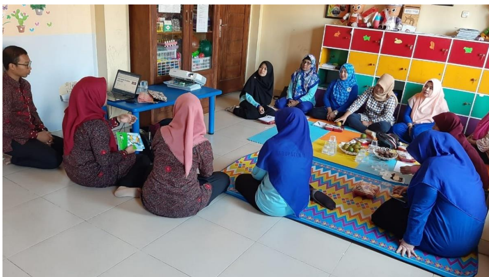
Gambar 3. FGD Pendampingan Penggunaan Software Aplikasi Keuangan