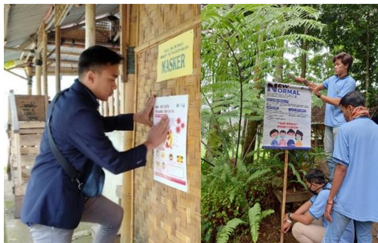
Gambar 3. Pemasangan Poster Pada Lokasi Strategis

Dalam perihal untuk mempermudah pelayanan yang diberikan oleh kantor desa untuk masyarakat Pandansari Lor, kami mendukung dengan membuat X-banner mengenai SOP administrasi yang berisikan berkas-berkas apa saja yang harus dilengkapi jika ingin membuat E-KTP, Kartu Keluarga, atau kebutuhan administrasi lainnya. X-banner yang kedua yaitu memperkenalkan profil desa dan menunjukkan potensi sumber daya yang ada di desa Pandansari Lor tersebut. Dengan harapan, potensi yang ada di desa Pandansari Lor diketahui oleh masyarakat luar sehingga dapat meningkatkan kesejahteraan desa Pandansari Lor sendiri. Kedua X-banner dipasangkan di kantor desa, yang diserahkan bersamaan dengan poster covid-19 dan new normal .