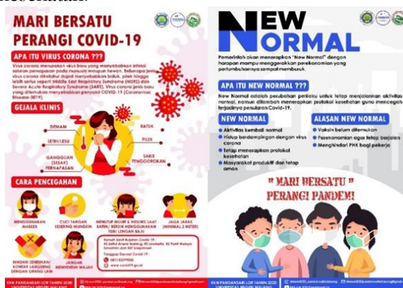
Gambar 2. Hasil Desain Poster Edukasi Cegah Covid-19

Salah satu kegiatan KKN UM Edisi Covid-19 ini yaitu membuat dua poster. Poster yang pertama, berisikan mengenai pengertian covid-19, gejala klinis, cara pencegahan, RS rujukan, dan call center yang dapat dihubungi. Dengan adanya poster ini, diharapkan masyarakat desa Pandansari Lor dapat lebih memahami covid-19 ini dengan baik. Dan jika terjadi sesuatu mengenai kesehatan mereka dapat menghubungi satgas covid-19 yang sudah tertera pada poster. Poster kedua yaitu berisikan konten new normal . Yang dimaksudkan agar masyarakat desa Pandansari Lor mengetahui kebijakan baru yang ditetapkan oleh pemerintahan. Dimana masyarakat menjalankan aktivitas normal dengan tetap memperhatikan protokol kesehatan.