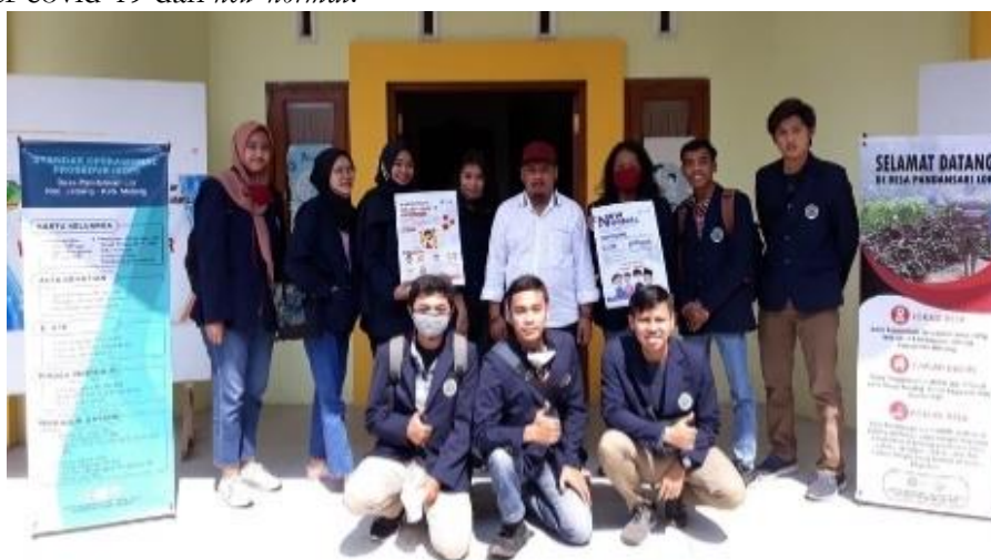
Gambar 4. Penyerahan Poster dan X-banner di Kantor Desa Pandansari Lor

Dalam perihal untuk mempermudah pelayanan yang diberikan oleh kantor desa untuk masyarakat Pandansari Lor, kami mendukung dengan membuat X-banner mengenai SOP administrasi yang berisikan berkas-berkas apa saja yang harus dilengkapi jika ingin membuat E-KTP, Kartu Keluarga, atau kebutuhan administrasi lainnya. X-banner yang kedua yaitu memperkenalkan profil desa dan menunjukkan potensi sumber daya yang ada di desa Pandansari Lor tersebut. Dengan harapan, potensi yang ada di desa Pandansari Lor diketahui oleh masyarakat luar sehingga dapat meningkatkan kesejahteraan desa Pandansari Lor sendiri. Kedua X-banner dipasangkan di kantor desa, yang diserahkan bersamaan dengan poster covid-19 dan new normal .