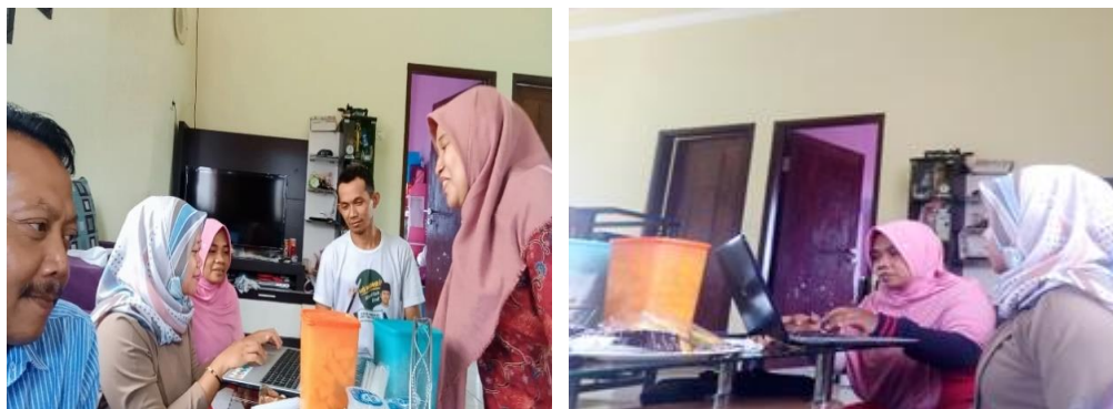
Gambar 9. Pendampingan dan Pelatihan sistem pelaporan keuangan

Secara ringkas hasil kegiatan ini dapat disimpulkan sebagai berikut :