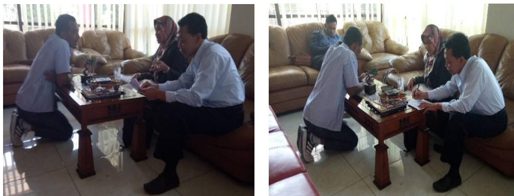
Gambar 4. Foto Kegiatan Training

Setelah dilakukan training maka dilakukan Implementasi Aplikasi Sistem Akuntansi yang sesuai dengan kebutuhan mitra. Berikut hasil implementasi aplikasi sistem akuntansi.