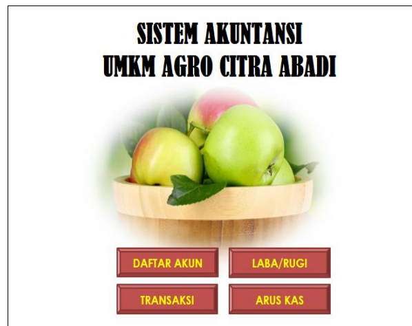
Gambar 3. Menu Sistem Pelaporan Keuangan Mitra

Berikut ini adalah tampilan menu pada aplikasi Sistem Akuntansi UMKM Agro Citra Abadi :