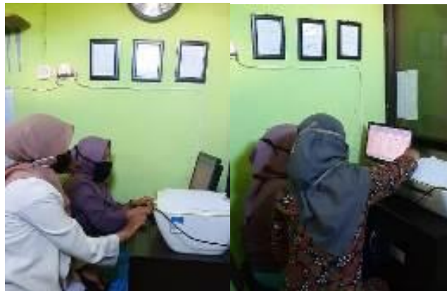
Gambar 4. Pendampingan Proses Input Data dan Penyajian Laporan Keuangan

Pada kegiatan ini kami mendampingi karyawan bagaimana menginput data-data ke dalam sistem. Pada langkah awal karyawan bisa memilih menu lalu menginput data ke menu akun dan saldo awal, jurnal umum, dan ringkasan. Setelah diinput maka secara otomatis dapat tersaji neraca lajur dan laporan laba rugi. Kegiatan pendampingan ini dilakukan baik secara langsung dan secara online (diskusi melalui Whatsapp).