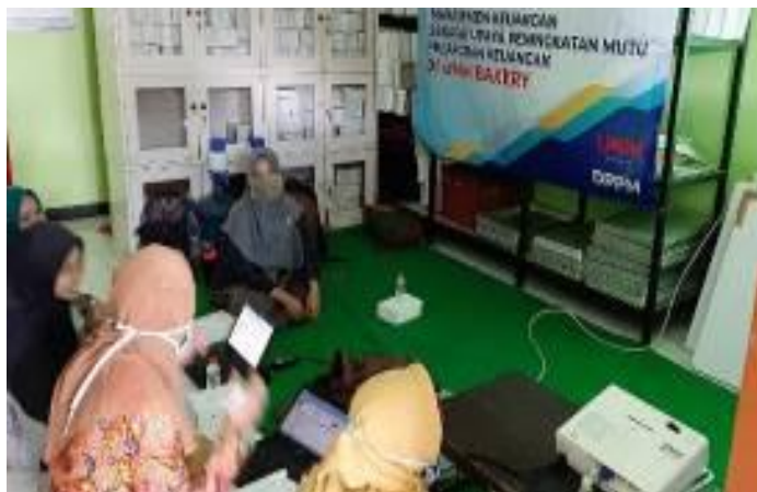
Gambar 1. Kegiatan Sosialisasi Manajemen Keuangan, Analisis Kelayakan Usaha, dan Akuntansi

sampaikan selama mengikuti sosialisasi ini, hal tersebut dikarenakan sebelumnya peserta kurang mengetahui cara pembuatan pelaporan keuangan yang cepat dan mudah diaplikasikan, serta kurangnya pemahaman tentang berbagai jenis biaya. Selama ini peserta mengelola keuangannya secara manual dan masih terdapat kesalahan dalam penggolongan jenis biaya. Adanya sosialisasi ini peserta menjadi terbuka wawasannya dan paham bagaimana mengelola keuangan dengan baik. Kegiatan sosialisasi manajemen keuangan dan akuntansi dapat dilihat pada Gambar 1.