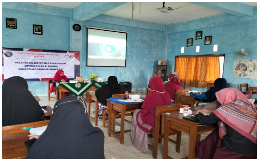
Gambar 2. Pelatihan Penyusunan Anggaran Berbasis Kinerja

Pelaksanaan pelatihan Manajemen Pengelolaan Anggaran Keuangan dan Aset dilaksanakan di SMP Boarding School Lawang Malang yang dihadiri oleh kepala sekolah, wakil kepala sekolah, bendahara sekolah dan perwakilan staf keuangan sekolah. Kegiatan peserta selama 1 hari. Dalam menyusun anggaran kinerja tahap pertama menetapkan strategi organisasi (visi dan misi). Visi dan misi merupakan cara pandang jauh kedepan dan memberikan gambaran tentang suatu kondisi yang harus dicapai oleh suatu organisasi. Visi dan misi organisasi harus dapat mencerminkan apa yang ingin dicapai; memverifikasi arah dan fokus strategi yang jelas; menjadi perekat dan menyatukan berbagai gagasan strategis; memiliki orientasi masa depan; menumbuhkan seluruh unsur organisasi; menjamin kesinambungan kepemimpinan organisasi. Langkah berikutnya pembuatan Tujuan. Tujuan yang dimaksud dalam hal ini adalah sesuatu yang akan dicapai dalam kurun waktu satu tahun atau tujuan operasional. Tujuan operasional harus memiliki beberapa karakteristik, Harus mempresentasikan hasil akhir ( true ends/ outcome ) bukannya keluaran ( output ), Harus dapat diukur dalam jangka pendek agar dapat dilakukan tindakan koreksi ( corrective action ), Harus dapat diukur menentukan apakah hasil akhir ( outcome ) yang diharapkan telah dicapai, Harus tepat artinya tujuan tersebut memberikan peluang kecil untuk menimbulkan interpretasi individu.