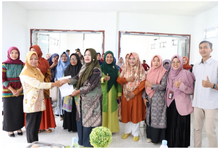
Gambar 5. Foto Penyerahan NIB kepada salah satu peserta pelatihan

Dalam acara pelatihan ini, proses tersebut dipersingkat dan peserta yang telah memenuhi semua persyaratan administratif seperti KTP dan NPWP bisa mendaftarkan usahanya melalui laman OSS. Pemateri memilih satu peserta yang dijadikan percontohan pengurusan NIB, dan hasilnya hanya dalam hitungan menit peserta tersebut telah berhasil mendapatkan NIB. Menurut pemateri, program ini bertujuan untuk memotong birokrasi yang sering kali menjadi hambatan bagi UMKM dalam mendapatkan legalitas usahanya. Peserta pelatihan mengaku sangat terbantu dengan program ini. Program pelatihan ini diharapkan dapat terus berlanjut di berbagai wilayah Indonesia untuk mendorong pertumbuhan UMKM dan memperkuat ekonomi lokal