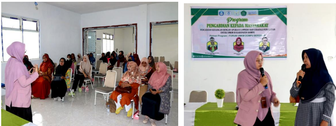
Gambar 7. Foto Penyampaian Materi Pencatatan Keuangan dengan Aplikasi LAMIKRO

Pemateri juga menjelaskan alasan UMKM seringkali tidak melakukan pencatatan keuangan, seperti keterbatasan waktu karena kesibukan dengan operasional sehari-hari, sehingga pelaku UMKM tidak memiliki waktu untuk melakukan pencatatan keuangan secara teratur. Selain itu, kompleksitas pencatatan yang dirasakan, dalam hal ini pelaku UMKM merasa kesulitan memahami prinsip-prinsip akuntansi dan membuat laporan keuangan yang benar. Para pelaku UMKM juga seringkali tidak dapat bukti transaksi penjualan maupun pembelian. Namun, dengan LAMIKRO, pencatatan keuangan menjadi lebih sederhana, sehingga pelaku usaha dapat dengan mudah mengetahui kondisi keuangan usaha mereka, membuat keputusan bisnis yang lebih tepat, serta meningkatkan akses terhadap pinjaman atau pendanaan (Bleskadit, 2024; Novitasari et al., 2023).