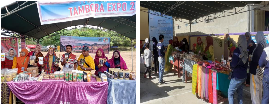
Gambar 1. Foto Kegiatan Forum UMKM Dompu Bersinar

diskusi dalam workshop mengenai pencatatan transaksi keuangan UMKM yang dilaksanakan di 2 lokasi berbeda yaitu di Dinas Koperasi Kabupaten Dompu, Kec. Dompu, serta di Desa Mbawi oleh dosen STIE YAPIS Dompu. Workshop ini menasar para pelaku usaha kecil khususnya di Kab. Dompu. Para pelaku UMKM mengaku bahwa mereka kesulitan untuk membuat laporan keuangan usaha meskipun dengan bentuk yang sederhana. Hal ini dikarenakan latar belakang pendidikan yang tidak mendukung, yaitu bukan berasal dari bidang ekonomi keuangan. Selain itu, kurangnya pengetahuan mengenai aturan penggunaan aplikasi keuangan yang sudah banyak tersedia di Playstore. Padahal dari hasil observasi awal dan informasi yang diperoleh saat sosialisasi program, hampir 95% pelaku usaha adalah pengguna gawai atau smartphone yang sudah terkoneksi dengan internet. Selain itu, hampir 70% UMKM belum memiliki perizinan usaha. Padahal hal tersebut sangat penting untuk kepercayaan pelanggan, mitra, bahkan calon investor ( Diana et al., 2022 ; Cantikasari et al., 2022 ; Sumiyati, et al., 2022 ).