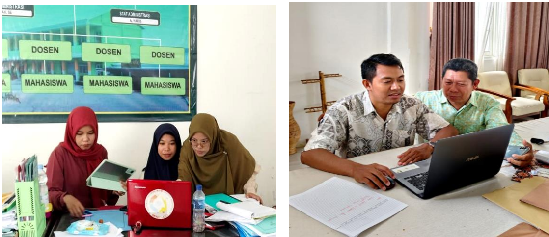
Gambar 8. Foto Proses Pendampingan Penggunaan Aplikasi LAMIKRO

Pelatihan ini mendapat respon positif dari para peserta yang sebagian besar adalah wanita yang juga sebagai Ibu Rumah Tangga. Mereka menyadari bahwa pencatatan keuangan sangat penting untuk mengukur keberhasilan usaha dan membantu mereka dalam merencanakan pengembangan bisnis ke depan. Oleh karena itu pada 14 September tim PkM melakukan pendampingan penggunaan Aplikasi LAMIKRO pada beberapa pelaku UMKM. Karena masih ada beberapa peserta pelatihan yang merasa kesulitan dalam melakukan pencatatan keuangan.