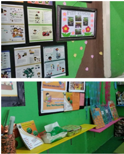
Gambar 1. Taman baca desa Kenongo

Sementara taman baca desa Grogol yang terletak di balai desa Grogol kecamatan Tulangan merupakan taman baca yang belum dikelola dengan baik, hal ini bisa dilihat dari sistem penempatan dan banyaknya koleksi buku yang ada, selain belum adanya petugas yang diberikan tugas khusus untuk mengelola taman baca tersebut, sehingga memberikan kesan bahwa taman baca desa tersebut bukanlah taman baca yang sewajarnya. Sementara dilingkungan balai desa terdapat sekolah Taman Kanak-kanak (TK), sehingga taman baca ini memberikan pesan yang sangat penting sebagai tempat kegiatan yang dapat menstimulus bagi anak usia dini untuk menyukai membaca dan dengan membangun gerakan budaya gemar membaca.