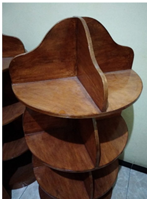
Gambar 6. Rak buku inovatif

Proses pembuatan dilakukan dengan memperhatikan tingkat kesulitan dan bahan yang dibutuhkan sehingga dalam pembuatan dilakukan oleh pihak ketiga, sementara desain dan ukurannya berdasarkan gambar yang telah dibuat. Berikut hasil akhir rak buku inovatif yang telah dibuat.