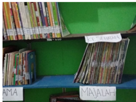
Gambar 3. Rak buku di Taman baca desa kenongo (Mitra 1)

Sementara permasalahan mitra 2 adalah karena taman baca di lingkungan balai desa yang berdekatan dengan sekolah taman kanan-kanan, namun Taman Baca tersebut belum memberikan kontribusi atas tumbuh kembang anak, hal ini dikarenakan sistem pengelolaan taman baca tidak dikelola dengan baik, tidak adanya inventori data koleksi buku yang dimiliki, sarana pendukung berupa rak buku di buat secara sederhana dan terbuka sehingga rawan kehilangan, kurangnya koleksi buku bacaan yang dimiliki.