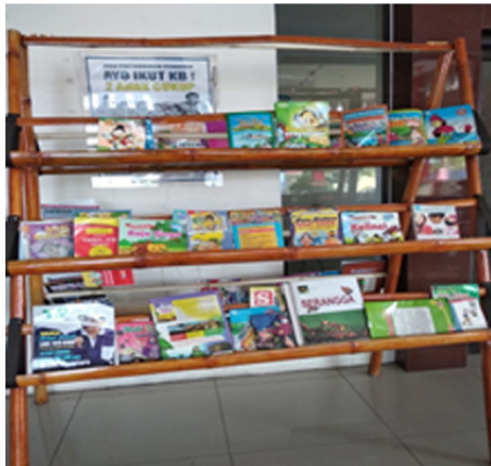
Gambar 4. Rak buku pada taman baca desa Grogol (Mitra 2)