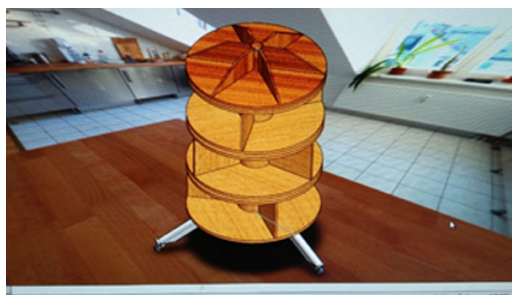
Gambar 5. Desain Rak buku Inovatif

Maka dengan pertimbangan tersebut desain rak dibuat sebagaimana gambar tersebut dibawah ini.