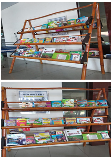
Gambar 2. Taman baca Desa Grogol

Sementara taman baca desa Grogol yang terletak di balai desa Grogol kecamatan Tulangan merupakan taman baca yang belum dikelola dengan baik, hal ini bisa dilihat dari sistem penempatan dan banyaknya koleksi buku yang ada, selain belum adanya petugas yang diberikan tugas khusus untuk mengelola taman baca tersebut, sehingga memberikan kesan bahwa taman baca desa tersebut bukanlah taman baca yang sewajarnya. Sementara dilingkungan balai desa terdapat sekolah Taman Kanak-kanak (TK), sehingga taman baca ini memberikan pesan yang sangat penting sebagai tempat kegiatan yang dapat menstimulus bagi anak usia dini untuk menyukai membaca dan dengan membangun gerakan budaya gemar membaca.