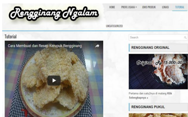
Gambar 5. Tutorial Membuat Rengginang