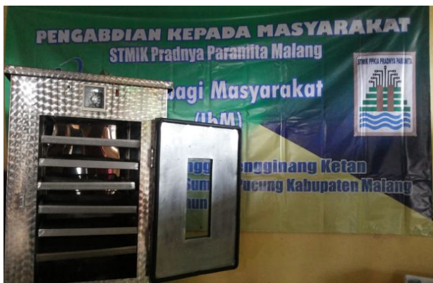
Gambar 1. Alat Pengering Posisi Terbuka