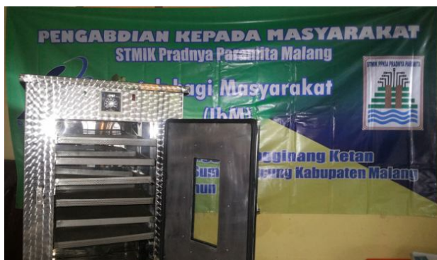
Gambar 2. Rak-Rak Alat Pengering