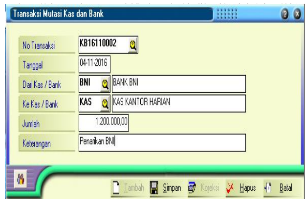
Gambar 9. Transaksi Keuangan Jurnal Lain, Mutasi Kas dan Bank