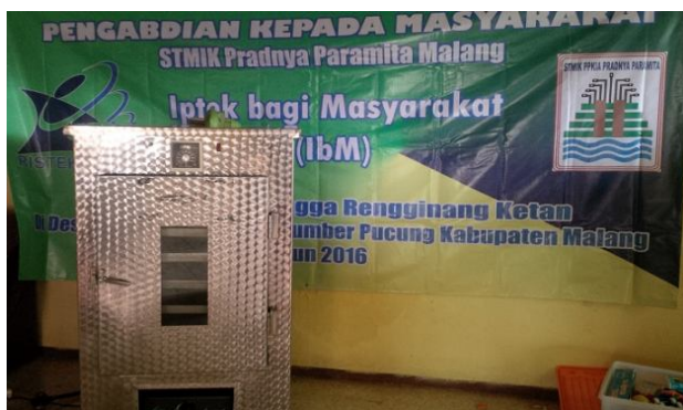
Gambar 3. Alat Pengering Posisi Tertutup