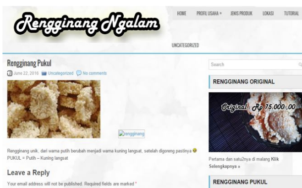
Gambar 6. Macam Rasa Rengginang Ketan