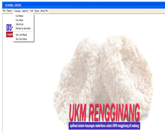
Gambar 7. Menu Utama Aplikasi Keuangan UKM Rengginang