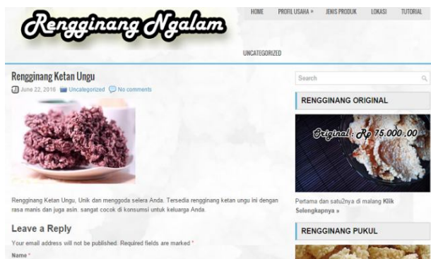
Gambar 4. Halaman Utama Website Promosi Rengginang Ketan

Telah dilakukan pembuatan website promosi rengginang ketan. Website ini berisi profil usaha, jesi produk yang dijual, lokasi, dan tutorial membuat rengginang ketan. Website ini masih terus dilakukan menyempurnaan konten sesuai dengan data yang ada di IRT. Gambar 4 sampai dengan Gambar 6 konten web yang sudah dibuat.