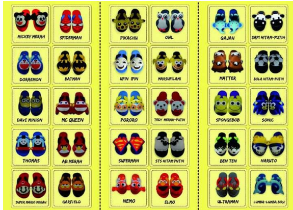
Gb.5. Katalog Sandal Flanel

pelanggan memesan sandal model mana saja yang akan dipesannya.