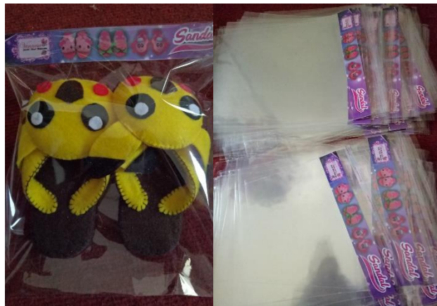
Gb.6. Packaging Sandal Flanel

Salah satu penentu dari nilai jual suatu barang adalah packagingnya yang menarik. Karenanya dibuatlah packaging sandal flanel dengan disertai label kemasan.