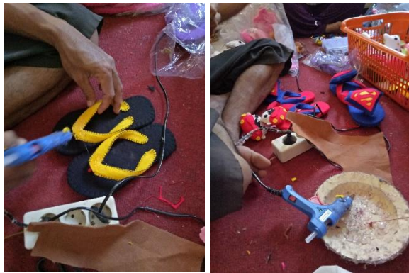
Gb.1 Proses pembuatan sandal flanel

sehingga butuh bantuan alat untuk mempercepat produksinya.