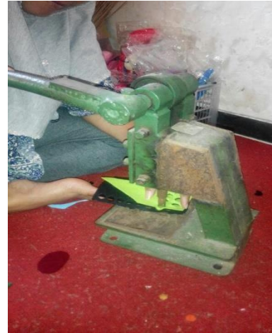
Gb.7. Mesin Pembulat Mata Boneka

produsen sandal flanel Vanessa berharap agar bisa dibuatkan mesin untuk melepas sandal yang selama ini masih manual menggunakan tangan. Berikut adalah gambar dari mesin bulatan mata boneka.