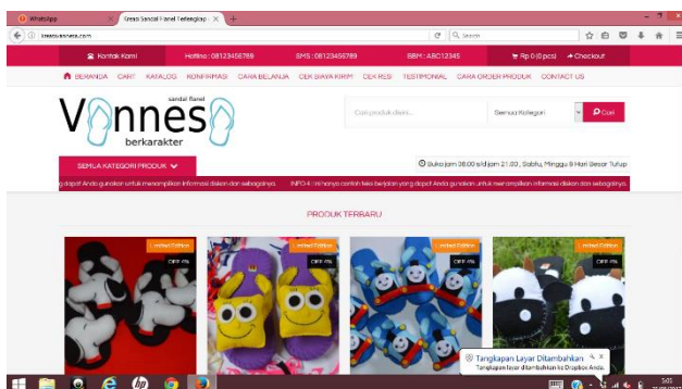
Gb.2 Web Kreasivannessa.com sebagai web resmi produsen sandal flanel

Pembuatan Web Kreasivannessa sebagai upaya memasarkan sandal flanel dan juga berbagai macam kerajinan dari flanel yang akan dimunculkan. Dimana web ini terintegrasi dengan media social yang lain seperti instagram, facebook, twitter, line dll. Diharapkan dengan pemanfaatan internet marketing ini maka akan menambah jalur pemasaran sandal flanel