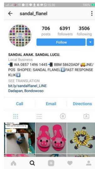
Gb.4. Instagram dari sandal flanel

Pembuatan Instagram sebagai salah satu upaya penjualan dari sandal, karena target market di Instagram sangat sesuai dengan karakteristik pecinta kerajinan tangan. Ini juga salah satu upaya pemasaran melalui internet marketing yang dilakukan oleh tim sebagai upaya meningkatkan jumlah pembeli sandal flanel.