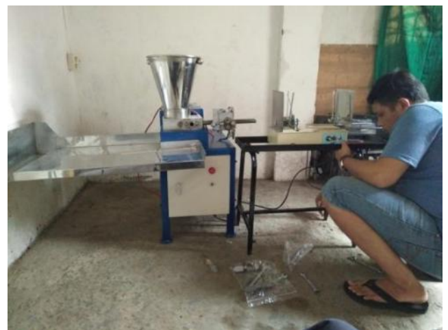
Gambar 3: bentuk mesin pembuat dupa otomatis dari lidi bambu