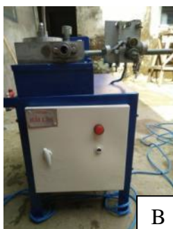
Gambar 1: mesin dupa tampak atas (A), dan tampak depan (B)