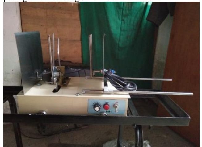
Gambar 2: Alat otomatis dupa sebagai penggerak lidi dupa

digerakkan secara otomatis dan lidi yang keluar sudah diikat dengan serbuk dupa sehingga lidi yang keluar sudah jadi dupa. Alat ini digerakkan dengan menggunakan tenaga listrik dengan daya sebesar 1.700 watt sehingga sangat cukup untuk menggerakkan mesin dupa ini. Namun kebanyakan pemilik usaha tidak memiliki daya sebesar 1.700 Watt, namun dengan keikutsertaan mitra IbM maka listrik yang dibutuhkan akan diupayakan sendiri, ini telah membuktikan bahwa mitra juga peduli dengan usaha yang dijalankan untuk menjadi lebih baik. Adapun bentuk alat otomatis dapat dilihat pada gambar 2, sedangkan gambar utuh dari mesin dupa semi otomatis dapat dilihat pada gambar 3 sebagai berikut: