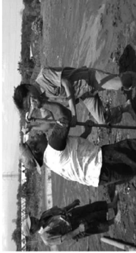
Gambar 1. Titik Pengeboran Pengambilan Sampel pada Sel IV

Titik pengeboran untuk pengambilan sampel di TPA Supit Urang, tepatnya di sel IV ini dapat dilihat pada gambar berikut: