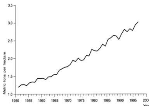
Gambar 1. Nama gambar (contoh gambar 1)