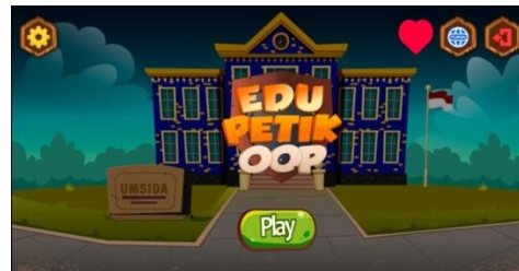
Gambar 3. Halaman Utama Game Edukasi

Desain antarmuka pengguna latar pada gim edukasi ini sebelum diolah pada gim engine ditunjukkan pada Gambar 3.