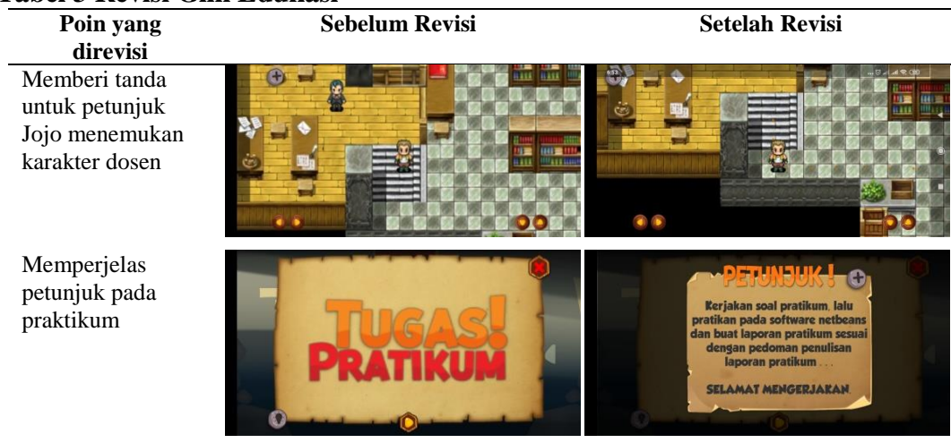
Tabel 3 Revisi Gim Edukasi

Berdasarkan Tabel 2 diperoleh persentase ahli materi yang meliputi indikator isi materi 93,2 % dan bahasa 93,3% dengan kriteria sangat tinggi. Persentase ahli media dengan indikator kualitas isi, yaitu 90 %, desain dan audio 95%, serta interaksi dan umpan balik 93,75% dengan kriteria sangat tinggi, sehingga dapat disimpulkan gim edukasi dinyatakan layak dan dilanjutkan untuk tahap uji coba skala terbatas. Pendapat dan saran pada penilaian yang diperoleh digunakan sebagai revisi untuk memperbaiki prototipe gim edukasi yang telah dibuat. Revisi yang dilakukan sesuai masukan dari validator ahli materi dan media ditunjukkan pada Tabel 3.