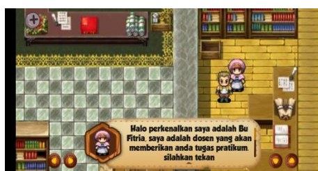
Scene Karakter Jojo Menerima Misi