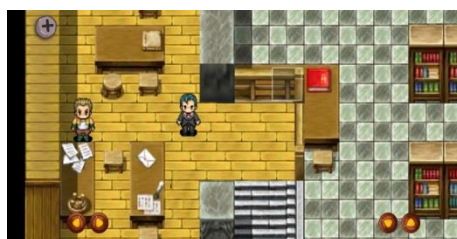
Scene Awal Gim Edukasi

Tahap develop merupakan tahap pembuatan produksi atau pengembangan gim edukasi. Jenis gim edukasi yang digunakan pada penelitian ini, yaitu jenis Role Playing Game (RPG). Gim berjenis RPG memiliki banyak variasi dan dinamika permainan yang dapat digunakan sebagai mekanisme untuk meningkatkan efektivitas pembelajaran. Skenario dengan menjadikan pemain sebagai tokoh utama dapat membantu penyampaian materi yang diajarkan di dalam permainan (Hermawan et al., 2017). Pengembangan gim dibuat sesuai dengan storyboard , dimulai dari pembuatan desain antarmuka pengguna, karakter dalam bentuk grafik, dan dikombinasikan dengan perangkat lunak game engine dengan pemberian fungsi dengan kode program. Pembuatan desain antarmuka pengguna menggunakan perangkat lunak desain grafis, yaitu Adobe Illustrator CC 2019 dan Affinity Designer. Gambaran tampilan antarmuka pengguna perjalanan Jojo menuju karakter Dosen ditunjukkan pada Gambar 4.