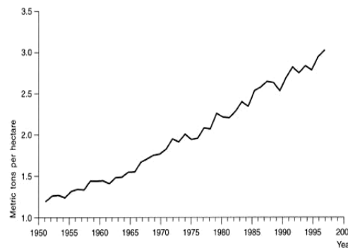
Gambar 1. Nama gambar [contoh gambar 1, TNR12, Spasi 1]