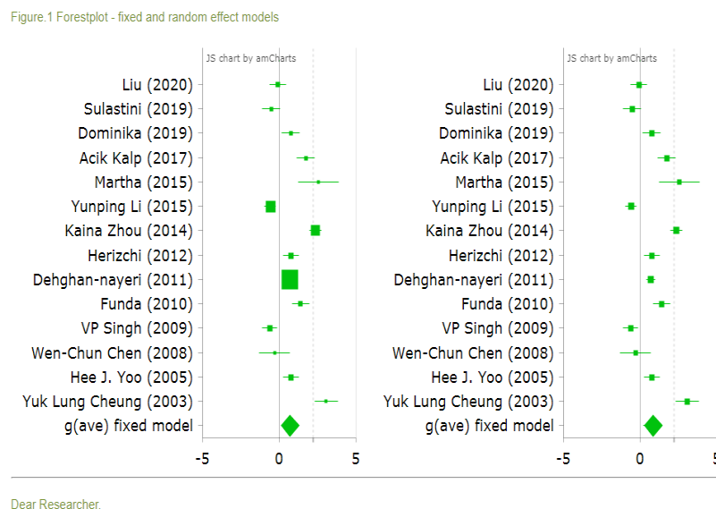
Forestplot - fixed effect models dan random effect models