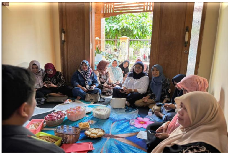
Gambar 3. Penerapan Teknologi

Dalam tahap ini, peserta diajarkan cara memanfaatkan berbagai platform digital untuk mempromosikan produk mereka. Program ini mengimplementasikan teknologi informasi dan komunikasi yang konkrit meliputi: penggunaan platform e-commerce spesifik (Shopee, Tokopedia, Instagram Business, dan Facebook Marketplace), aplikasi content creation (Canva Pro, PicsArt, CapCut), dan WhatsApp Business untuk customer service . Peserta juga diberikan peralatan pendukung seperti ring light dan tripod smartphone untuk meningkatkan kualitas konten visual produk. Pemilihan teknologi ini didasarkan pada kemudahan penggunaan, popularitas di kalangan konsumen Indonesia, dan biaya yang terjangkau untuk keberlanjutan program (Waskithoaji and Aditya, 2022; Febriyantoro et al., 2018).