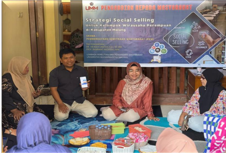
Gambar 2. Pelatihan Digital Marketing