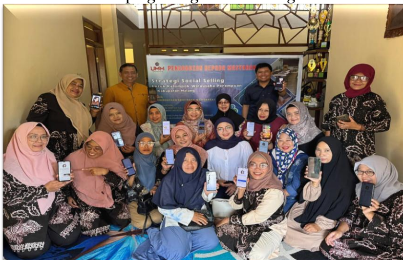
Gambar 4. Pendampingan Digital Marketing

Setelah pelatihan, tim pengabdian memberikan pendampingan berkelanjutan untuk memastikan peserta dapat menerapkan keterampilan yang telah dipelajari. Kegiatan ini mencakup pendampingan dalam pembuatan konten digital, membantu peserta dalam mengelola akun bisnis online dan memasarkan produk secara efektif, serta evaluasi berkala terhadap perkembangan peserta baik dari segi produksi maupun pemasaran. Evaluasi dilakukan setiap bulan untuk mengukur kemajuan dan memberikan umpan balik yang konstruktif. Mahasiswa terlibat aktif dalam proses pendampingan dengan melakukan dokumentasi, evaluasi, dan memberikan pendampingan teknis kepada peserta. Pendampingan ini penting untuk memastikan transfer pengetahuan yang efektif dan memberikan solusi atas kendala yang dihadapi peserta dalam implementasi.