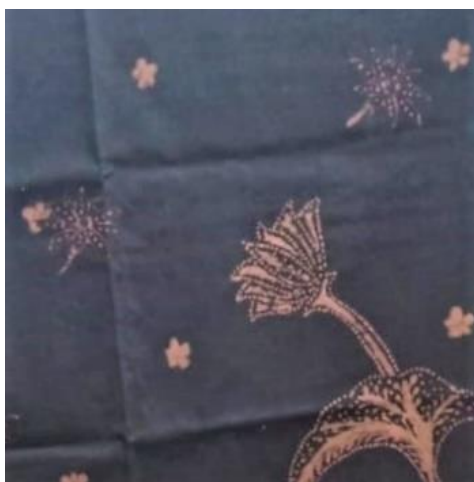
Gambar 2. Motif Bunga Teratai

Di dalam Batik Teratai terdapat tiga motif yang menonjol, antara lain motif bunga teratai, daun bunga teratai, dan sulur-sulur. Bunga Teratai merupakan salah satu simbol Kota Malang, yang melambangkan keindahan juga kesuburan. Pada kisah cerita kuno hindu di era Kerajaan Singosari, bunga teratai merupakan salah satu jenis bunga tempat Dewa Wishnu, sebagai dewa pemelihat alam, bertahta. Makna yang terkandung dari bunga ini yaitu kearifan atau kebijaksanaan yang mengakibatkan kemakmuran bagi masyarakat yang dipimpinnya. Contoh yang paling mudah yaitu kepala keluarga, sehingga sangat pas sekali jika seorang kepala keluarga mengenakan motif batik malang ini dalam bekerja atau mencari nafkah. Diharapkan pemakainya senantiasa subur makmur dan terpelihara jiwa dan raganya.