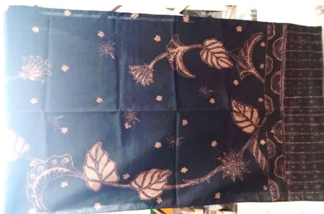
Gambar 1. Motif batik teratai

Bentuk Batik Teratai yang muncul adalah bentuk garis seperti pada motif sulur-sulur. Bentuk bidang yang muncul pada Batik teratai adalah bentuk pada daun bunga teratai yaitu bentuk oval atau bundar. Bentuk-bentuk itu adalah terdiri bunga Teratai, daun, dan sulur-sulur. Selain itu warna yang digunakan pada latar batik teratai adalah dominan warna hitam. Motif bunga teratai yang merupakan salah satu simbol Kota Malang, yang melambangkan keindahan dan kesuburan. Bunga Teratai memiliki bunga yang berkelopak yang indah dan berkarakter elastis yang dapat berayun ketika terhepas oleh angin sehingga mampu memperindah tampilannya menjadi lebih menarik untuk diceritakan dalam bentuk motif batik. Motif batik bunga teratai yang diciptakan dapat menggambarkan karakter teratai yang indah dan menawan saat dipandang mata. Motif batik teratai menggambarkan pikiran manusia untuk belajar mencapai kesempurnaan dalam menjalani kehidupan. Kesempurnaan yang digambarkan dengan keindahan mahkotanya dan usaha mencapai kesempurnaan yang tersirat dalam kehidupan, teratai