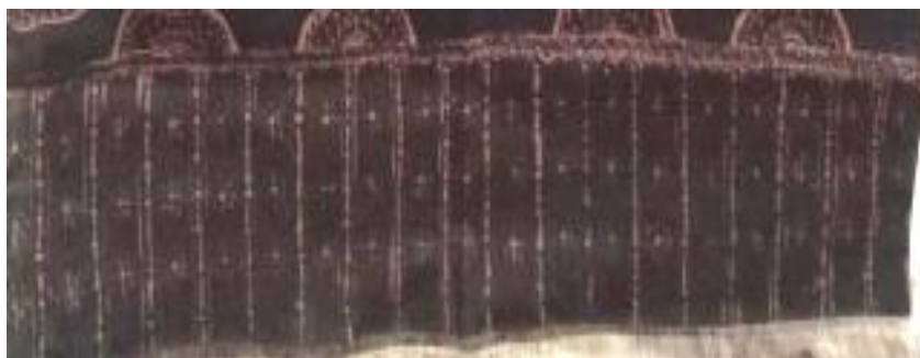
Gambar 3. Sulur-sulur

Di dalam Batik Teratai terdapat tiga motif yang menonjol, antara lain motif bunga teratai, daun bunga teratai, dan sulur-sulur. Bunga Teratai merupakan salah satu simbol Kota Malang, yang melambangkan keindahan juga kesuburan. Pada kisah cerita kuno hindu di era Kerajaan Singosari, bunga teratai merupakan salah satu jenis bunga tempat Dewa Wishnu, sebagai dewa pemelihat alam, bertahta. Makna yang terkandung dari bunga ini yaitu kearifan atau kebijaksanaan yang mengakibatkan kemakmuran bagi masyarakat yang dipimpinnya. Contoh yang paling mudah yaitu kepala keluarga, sehingga sangat pas sekali jika seorang kepala keluarga mengenakan motif batik malang ini dalam bekerja atau mencari nafkah. Diharapkan pemakainya senantiasa subur makmur dan terpelihara jiwa dan raganya.