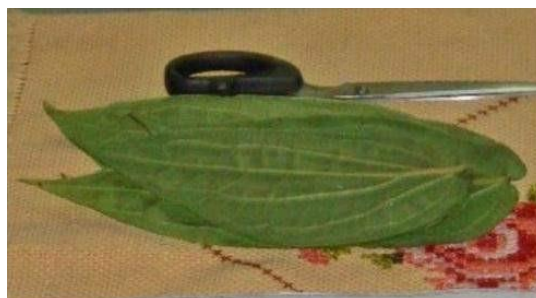
Gambar 11. Daun Sirih