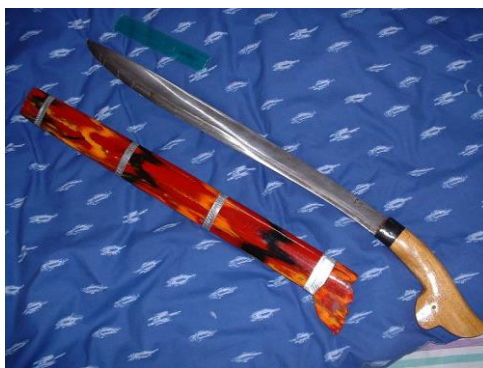
Gambar 8. Guma untuk Laki-laki Suku Pamona

Guma atau parang adalah ornamen pelengkap bagi kaum laki-laki yang diikat pada pinggang. Guma adalah alat yang digunakan untuk bekerja, berkebun, maupun berburu di hutan, sehingga guma memiliki makna sebagai kerja keras. Hal ini menunjukkan bahwa kaum laki-laki Suku Pamona adalah kepala keluarga yang pekerja keras dan bertanggung jawab untuk kehidupan keluarganya.