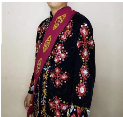
Gambar 7. Selempang untuk Laki-laki Suku Pamona

Selempang adalah pelengkap pada pakaian adat laki-laki Suku Pamona. Selempang itu sendiri menyerupai kain yang melingkar dari bahu kiri ke pinggang kanan. Selempang bermakna sebagai penghangat tubuh, yang bermakna bahwa kaum laki-laki Suku Pamona sangat bertanggung jawab dengan memberi tanggung jawab dan kehidupan layak bagi keluarganya. Kehangatan yang dimaksud dapat memberi aura positif, dan membentuk kehidupan rumah tangga yang harmonis untuk istri dan kehidupan anaknya kelak.