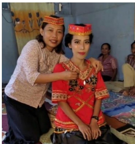
Gambar 3. Pemasangan Kalung emas