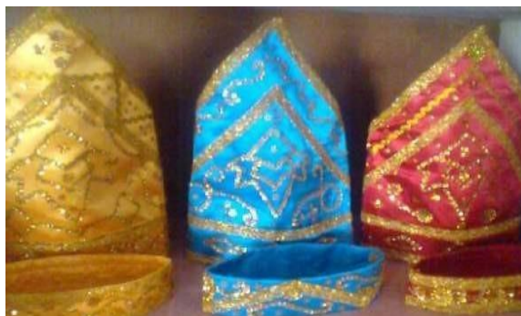
Gambar 5. Siga untuk Laki-laki Suku Pamona

Siga atau penutup kepala bagi kaum laki-laki adalah salah satu ornamen pakaian adat Pamona yang membuat pemakainya terlihat gagah dan berwibawa. Sama seperti pada beberapa suku di Indonesia, di mana kaum laki-laki mereka menggunakan topi yang memiliki ciri khas. Siga bermakna sebagai petunjuk untuk membedakan tingkat kedudukan seseorang dalam adat istiadat suku Pamona. Untuk ketua adat atau dewan adat, menggunakan siga dengan lipatan bagian ujung mengarah ke depan. Siga yang digunakan orang dipemerintahan adalah siga yang lipatan ujungnya mengarah kekanan, sementara itu siga yang menyumbul kekiri adalah siga yang digunakan oleh para tokoh masyarakat. Bentuk siga terakhir, yakni yang diperuntukan bagi masyarakat umum adalah siga dengan bentuk ujung mengarah kebelakang.