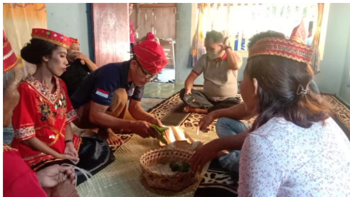
Gambar 2. Proses Mabulere Mamongo

Prosesi mabulere mamongo adalah prosesi membuka bungkusan pinang atau mamongo , di mana dengan dibukanya bungkusan mamongo tersebut menandakan bahwa pinangan atau lamaran calon mempelai laki-laki berpeluang diterima. Sebelum bungkusan mamongo dibuka, dewan adat dari pihak laki-laki akan menyerahkan bungkusan mamongo tersebut kepada dewan adat dari pihak perempuan. Kemudian, dewan adat dari pihak perempuan akan bertanya kepada calon mempelai perempuan, “ Se’i jela ada ri woto ngkoromu, ana. Kami tau tu’a sinjo’u roo kupekune, jamo ri tumpu ngkoromu bara da nda bulere ada sei bara wambe’i? ”. Kalimat tersebut berarti “Ini ada adat yang diantar untuk melamarmu, nak. Saya sudah bertanya kepada para orang tua yang hadir dan kami memutuskan untuk bertanya langsung kepada kamu, apakah akan dibuka sekarang atau bagaimana?”. Setelah itu, calon mempelai perempuan akan menjawab, “ ri kajela ada se’i, kupesarukamo ri komi waa tau tu’a ”, yang berarti “Adat ini saya percayakan kepada kalian, para orang tua”.