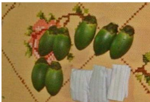
Gambar 10. Buah Pinang

Wua Mamongo atau buah pinang adalah salah satu isi dari bungkusan mamongo yang wajib ada. Buah pinang yang digunakan hanya yang berbentuk lonjong dan berjumlah tujuh buah. Adapun buah pinang yang dipakai harus dalam kondisi utuh dan lengkap dengan penutupnya. Buah pinang dimaknai sebagai gambaran jantung manusia (condong kepada si mempelai laki-laki). Pemaknaan ini tentu sangat dalam, di mana pihak laki-laki yang akan melamar tentu berdasarkan rasa cinta kepada si perempuan. Oleh karena itu, memberikan jantung merupakan bukti yang sangat nyata akan keseriusannya.