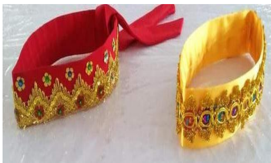
Gambar 6. Tali Bonto untuk Perempuan Suku Pamona

Tali bonto atau pengikat kepala bagi kaum perempuan bermakna untuk memperindah rambut perempuan Suku Pamona, sekaligus sebagai pelengkap pakaian adat agar terlihat lebih menawan. Keindahan tali bonto terletak pada ujung belakangnya yang menjuntai sebah dan menyerupai rambut. Pada masa lampau, para nenek moyang suku pamona menggunakan tali bonto sebagai alas kepala ketika menjunjung bakul. Hal tersebut dimanai dengan simbol kekuatan dan kerja keras.