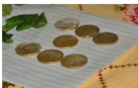
Gambar 13. Tujuh Buah Doi Benggol

Doi Benggol atau diartikan sebagai uang logam, di dalam proses mamongo hanya digunakan sebanyak tujuh buah dan berwarna kuning. Uang logam ini memiliki makna tersendiri sebagai tamba atau biaya pengganti untuk pelepah pinang atau daun sirih, apabila ditemukan kerusakan (bocor atau sobek) yang mungkin saja terjadi selama prosesi adat Mantende Mamongo . Mengutip pernyataan dari Pither Dongalemba selaku ketua adat, bahwa apabila selama prosesi Mantende Mamongo didapati kerusakan pada bungkusan mamongo atau ira laumbe , maka hal tersebut merupakan tindakan pelecehan kepada calon mempelai perempuan. Selain menjadi tamba , uang logam juga dimaknai sebagai rongisinya , yaitu kata yang berasal dari kata rongi yang memiliki arti “bau amis”. Hal ini dimaknai dengan aroma anak kecil atau bayi. Maksudnya adalah, makna tersebut dijadikan sebagai harapan bagi kedua calon mempelai untuk dapat segera memiliki keturunan setelah menikah. Akan tetapi, terdapat kerusakan maupun tidak, uang logam tetap wajib dimasukkan ke dalam bungkusan mamongo .