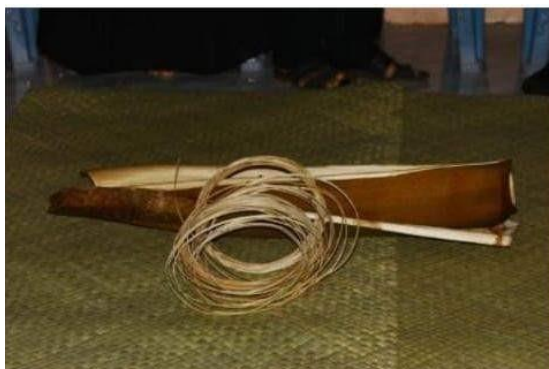
Gambar 9. Pelepah Pinang dan Rotan

menyatukan dua pihak keluarga menjadi kesatuan, sehingga dapat hidup dalam kebersamaan. Cara mengikatnya disebut dengan timbu'u , yaitu proses mengikat dengan kuat di setiap bagian tengah baris. Ikatannya berjumlah tujuh baris dan tiap baris terdiri dari dua ikatan. Selama proses mengikat, rotan tersebut tidak boleh dipotong atau pun terputus.