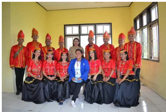
Gambar 4. Pakaian Adat Suku Pamona