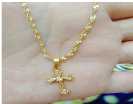
Gambar 14 Kalung Emas

Enu atau gongga memiliki arti yaitu kalung yang umumnya berupa kalung emas. Kalung adalah satu benda yang dipakaikan dengan cara dikait pada kedua bagian ujungnya, sehingga enu dianggap menjadi simbol ikatan atau penyatuan kedua calon mempelai. Kalung yang dipasangkan di leher calon mempelai perempuan memiliki makna bahwa mempelai perempuan tersebut telah terikat oleh pertunangan dengan mempelai pria yang akan menikahinya, sehingga calon mempelai perempuan tersebut tidak boleh berhubungan atau menerima lamaran dari pihak laki-laki manapun.