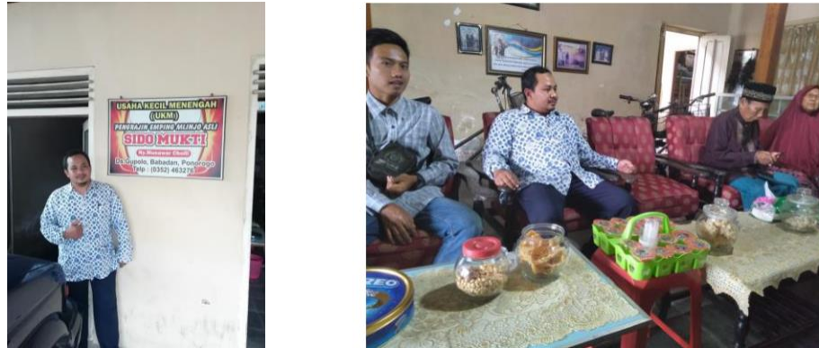
Gambar 3. Observasi dan wawancara pada kelompok usaha sido mukti

mengenai proses pengupasan kulit luar melinjo serta permasalahan yang dihadapi mitra ketika proses produksi. Proses observasi dan wawancara ditunjukkan pada Gambar 3.