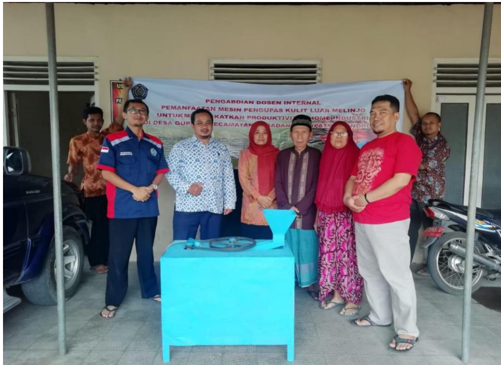
Gambar 4. Penyerahan alat kepada mitra