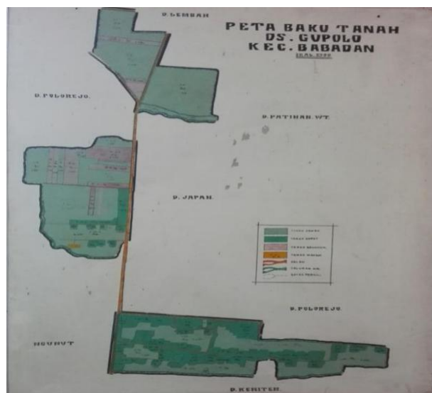
Gambar 1. Denah Peta Desa Gupolo

Pada Desa Gupolo merupakan salah satu desa yang terletak di Kecamatan Babadan, Kabupaten Ponorogo. Bagian utara berbatasan dengan Desa Polorejo dan Japan, selatan berbatasan dengan Desa Keniten dan Desa Ngunut, bagian timur berbatasan dengan Desa Keniten, Japan, Lembah, dan barat berbatasan langsung dengan Desa Polorejo dan Desa Ngunut. Luas Desa ini ialah 126,62 Ha dan memiliki iklim tropis.