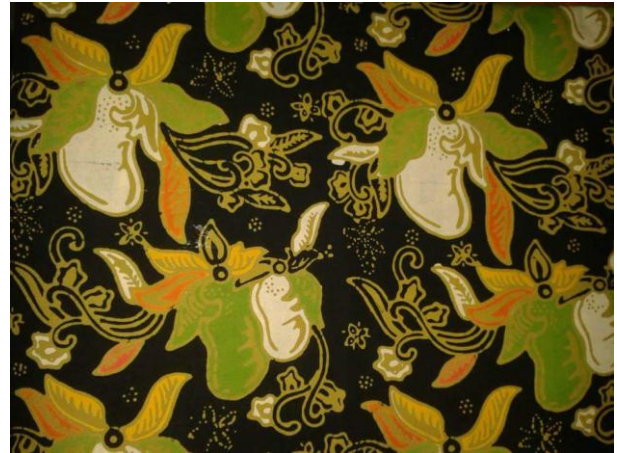
Gambar 7. Batik Jonegoro Motif 3.