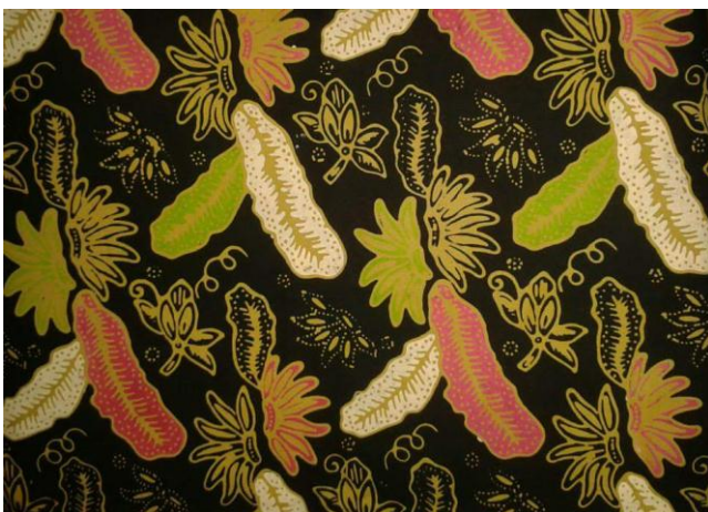
Gambar 6. Batik Jonegoro Motif 2.