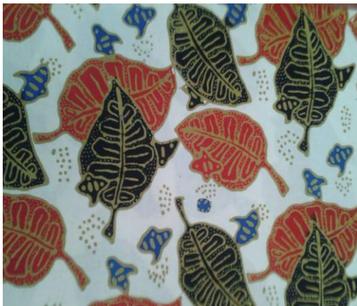
Gambar 5. Batik Jonegoro Motif 1

Para pengrajin di Dolok Gede belum berusaha melakukan strategi pemasaran secara proaktif kepada konsumen potensial mereka. Para pengrajin belum melakukan segmentasi pasar untuk produk mereka. Para pengrajin tersebut belum menentukan target konsumen tertentu, sehingga produk yang dihasilkan motifnya bersifat umum. Berdasarkan hasil wawancara, hal ini disebabkan karena para pengrajin merasa tidak memiliki kemampuan dan pengetahuan yang cukup untuk melakukan pemasaran secara proaktif, meskipun rata-rata para pengrajin tersebut memiliki tingkat pendidikan setingkat SMA. Bahkan satu diantaranya memiliki tingkat pendidikan D1 dibidang komputer.