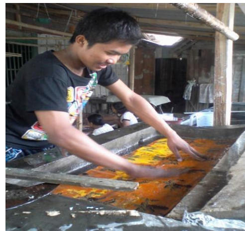
Gambar 4. Proses Pencucian Batik Jonegoro

Kapasitas produksi ini masih jauh lebih rendah jika dibandingkan pengrajin batik di Tasikmalaya yang dapat menghasilkan 200 potong kain batik perminggunya. Contoh hasil produksi batik jonegoro dapat dilihat di gambar 2 – 4 dibawah.