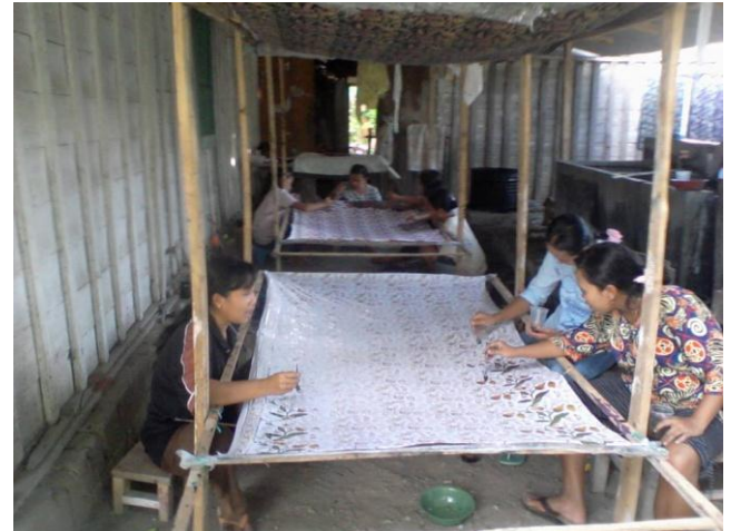
Gambar 3. Proses Pewarnaan Batik Jonegoro

sekar rinambat; Meliwis mukti; Khayangan api dahono mungal; Jangung miji emas dan lima motif batik Jonegoroan baru yaitu : Pelem-pelem suminar; Sekar rosella; Woh roning pisang; Surya salak kartika; Belimbing lining limo. Para pengrajin juga memproduksi kain batik dengan jenis pewarnaan : Laseman, Rinning, Coletan, Cabutan dan Smok. Sampai saat ini, pengrajin Dolok Gede rata-rata memiliki kapasitas produksi sebanyak ± 10 lembar kain batik perharinya kecuali jenis Coletan yang hanya dapat diproduksi 1 kain perbulannya.