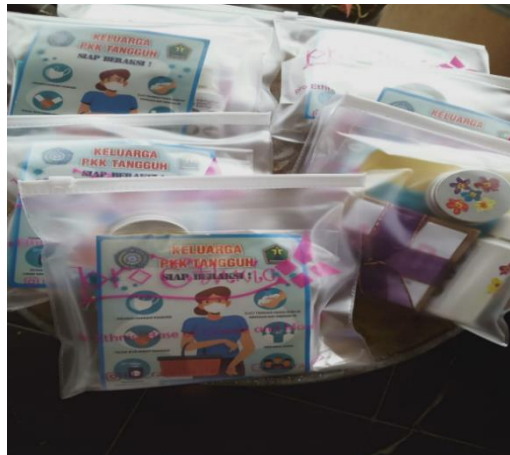
Gambar 12. Aloe Vera New Normal Essential kit