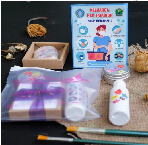
Gambar 5. Kemasan New Normal Essential Kit traveling