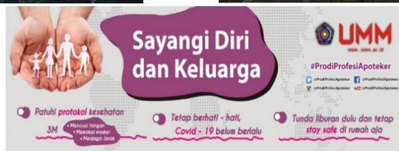
Gambar 11. Pemasangan spanduk pencegahan COVID-19