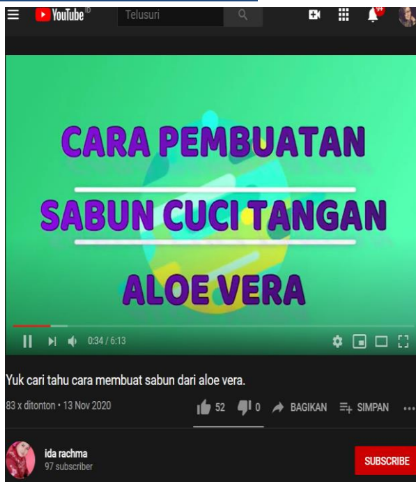
Gambar 8. Video Youtube Cara Pembuatan Sabun cuci tangan dari aloe vera

Pembuatan sabun cair juga dibagikan ilmunya melalui video pembelajaran berikut dengan link youtube : https://www.youtube.com/watch?v=ZKdE2duCsrU&t=13s