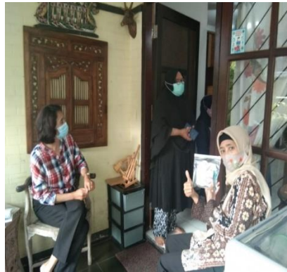
Gambar 10. Sosialisasi Luring 6M dan pengukuran saturasi

Sosialisasi dengan metode penyuluhan Gerakan 6M dan Pemeriksaan suhu dan Saturasi Oksigen