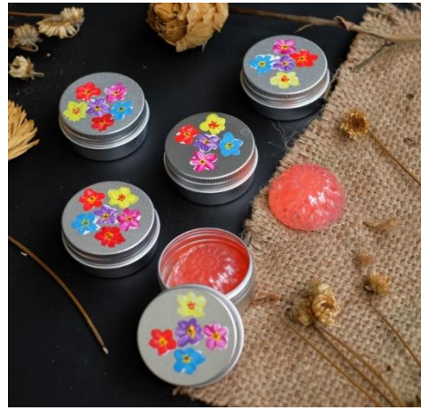
Gambar 2. Produksi sabun transparant dari Aloe vera