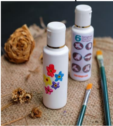
Gambar 3. Sabun cair cuci tangan Aloe vera dengan botol lukis