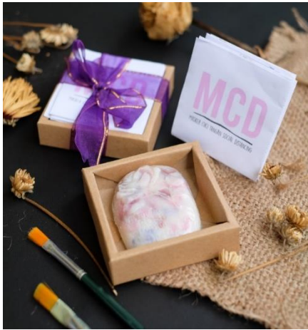
Gambar 1. Produksi sabun padat Aloe vera