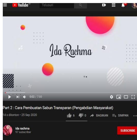
Gambar 7. Video Youtube Cara Pembuatan Video Transparant

Video ini berisi tahapan pembuatan sabun transparan, berbeda dengan sabun padat pada umumnya, pembuatan sabun transparan membutuhkan kehati-hatian lebih. Berikut adalah link youtube video tersebut: https://www.youtube.com/watch?v=w6Au2WAqbPM