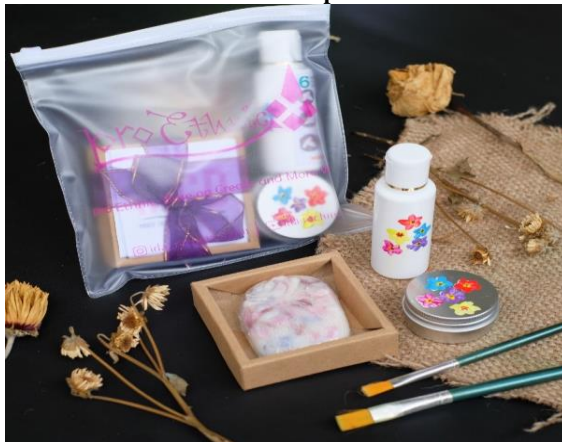
Gambar 4. Kemasan New Normal Essential Kit traveling atau souvenir