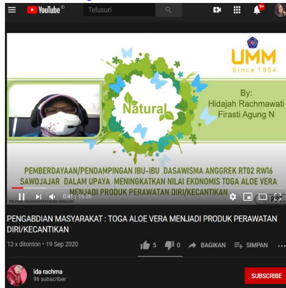
Gambar 6. Video Youtube Pengenalan Aloe Vera

https://www.youtube.com/watch?v=gJDFMamucUk