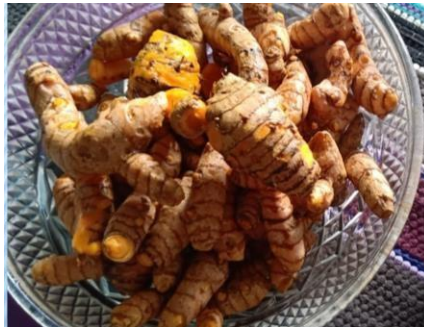
Gambar 5. Kunir (Bahan Baku Kunir Instan)

Pelaksanaan kegiatan pembuatan produk kunir instan, prosesnya hamper sama dengan cara pembuatan jahe instan, pertama-tama menyiapkan bahan-bahan dan peralatan yang dibutuhkan. Bahan untuk membuat kunir instan dengan kualitas yang bagus dibutuhkan 1 kg kunir dan 1 kg gula pasir. Langkah pertama kunir dibersihkan sampai betul-betul bersih, kemudian dpotong-potong/diiris-iris untuk mempermudah proses blendernya. Air yang dibutuhkan untuk proses blender 1 mangkok sekitar ½ liter, kunir di blender secara bertahap, air perasan kunir yang telah diblender digunakan untuk kuniryang akan diblender berikutnya demikian seterusnya sampai kunir selesai di blender semuanya.