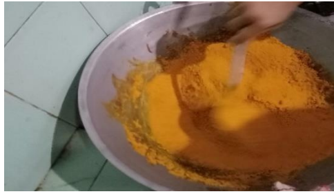
Gambar 6. Proses Pembuatan Kunir Instan (Tahan Pengkristalan)

Perhitungan secara ekonomis pembuatan produk kunir instan modal yang dibutuhkan: