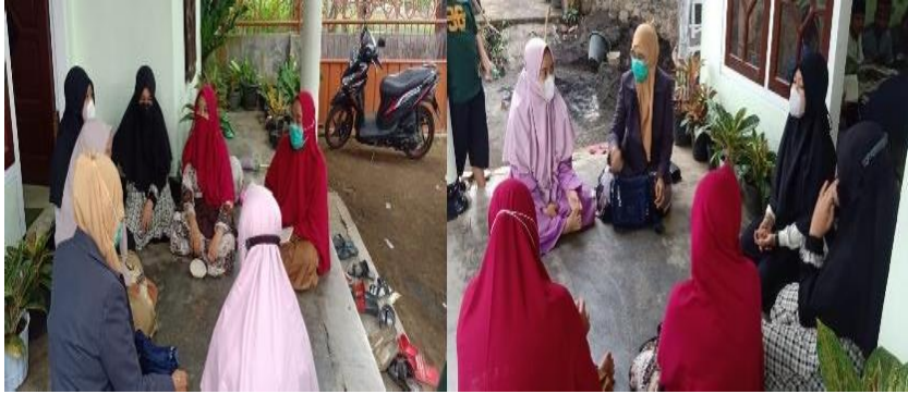
Gambar 2. Kegiatan Sosialisasi