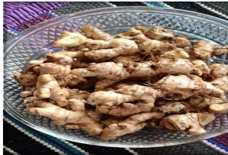
Gambar 3. Jahe (Bahan Baku Jahe Instan)

Pelaksanaan kegiatan pembuatan produk Jahe instan, pertama-tama menyiapkan bahan-bahan dan peralatan yang dibutuhkan. Bahan untuk membuat jahe instan dengan kualitas yang bagus dibutuhkan 1 kg Jahe dan 1 kg gula pasir. Langkah pertama jahe dibersihkan sampai betul-betul bersih, kemudian dpotong-potong/diiris-iris untuk mempermudah proses blendernya. Air yang dibutuhkan untuk proses blender 1 mangkok sekitar \frac{1}{2} liter, jahe di blender secara bertahap, air perasan jahe yang telah diblender digunakan untuk jahe yang akan diblender berikutnya demikian seterusnya sampai jahe selesai di blender semuanya.