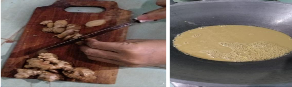
Gambar 4. Proses Pembuatan Jahe Instan

Hasil yang diperoleh dengan bahan tersebut diatas dapat menghasilkan 1kg sampai 1kg lebih 1 ons jahe instan. Jahe instan yang telah jadi dapat dimasukkan dalam kemasan botol dengan harga botolnya Rp.2000,- isi 1,8 ons per botol, atau kemasan plastic agak tebal harganya sekitar Rp.250,- dengan isi 1 ons. Penjualan pada umumnya yang kemasan botol 1,8 ons dengan harga sekitar Rp.18.000,- sampai Rp.20.000,- sedangkan yang kemasan palstik 1 ons harga jualnya antara Rp.10.000 sampai Rp.12.000,-