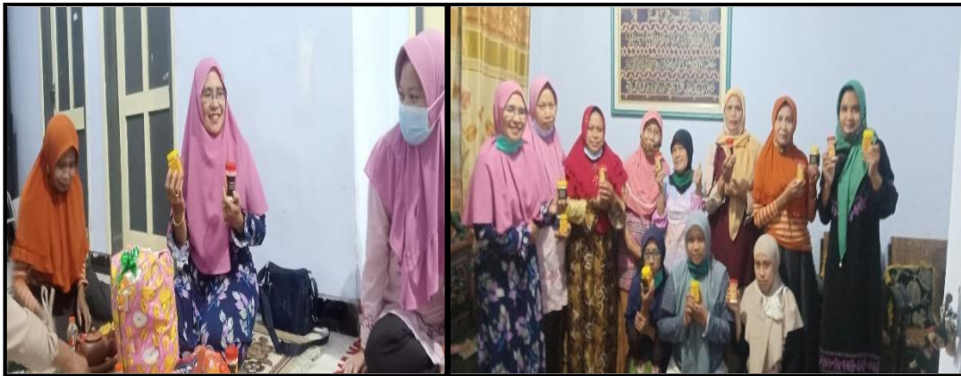
Gambar 7. Pelatihan membuat design packaging produk

Pada prinsipnya label kemasan produk jahe instan dan Kunir/kunyit instan yang dibuat, selain menarik komposisi warnanya, juga memberikan informasi bahan yang digunakan dan memberikan informasi manfaat dari produk tersebut.