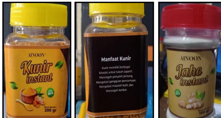
Gambar 8. Kemasan Produk

Pada prinsipnya label kemasan produk jahe instan dan Kunir/kunyit instan yang dibuat, selain menarik komposisi warnanya, juga memberikan informasi bahan yang digunakan dan memberikan informasi manfaat dari produk tersebut.