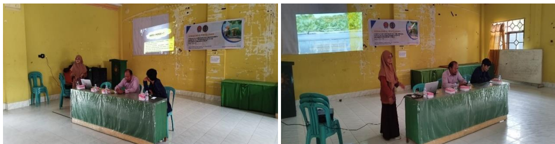
Gambar 3. Penyuluhan Sistem Aeroponik

keterampilan dalam memproduksi makanan sendiri dengan teknologi yang ramah lingkungan dan efisien seperti aeroponik. Selain itu, diharapkan juga dapat membangkitkan keinginan anak-anak panti asuhan untuk hidup mandiri dengan menanam sendiri sayuran di rumah atau lingkungan sekitar. Dalam jangka panjang, diharapkan kegiatan penyuluhan ini dapat membantu anak-anak panti asuhan Sejati Muhammadiyah Rappang untuk menjadi lebih mandiri dan mampu memenuhi kebutuhan pangan mereka sendiri. Selain itu, dengan adanya pengetahuan dan keterampilan dalam teknologi aeroponik, diharapkan anak-anak panti asuhan dapat menjadi agen perubahan di tengah masyarakat sekitar dan membantu meningkatkan produktivitas pertanian secara berkelanjutan. Menurut (Lestari et al., 2021) melalui transfer ilmu dan teknologi tentang budidaya sayuran akan mendatangkan manfaat yang besar bagi anak panti secara ekonomi dalam mengurangi pengeluaran untuk membeli kebutuhan akan sayuran segar dan berkualitas, dan apabila hasil melebihi kebutuhan maka dapat dijual sehingga menambah pendapatan. Adapun dokumentasi kegiatan ini dapat dilihat pada Gambar 3.