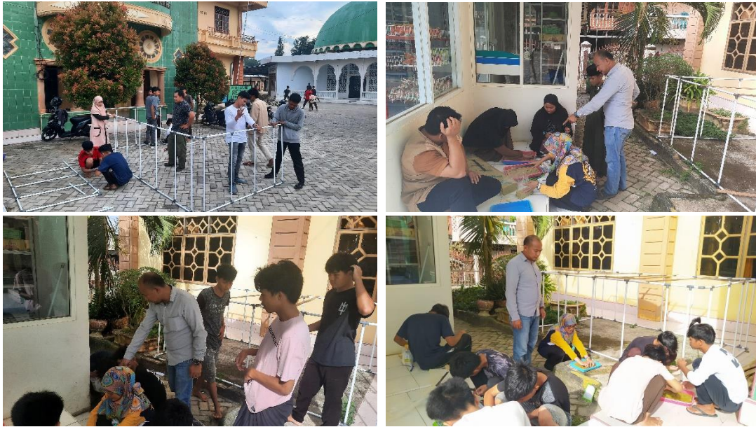
Gambar 4. Pelatihan Sistem Aeroponik dan Pemasaran Hasil

Dari hasil kegiatan pengabdian ini dirasakan perlu melakukan monitoring dengan mencatat perkembangan, memantau proses dan kemajuan pelaksanaan kegiatan secara terus-menerus. Selain itu, perlu dilakukan kegiatan evaluasi dengan mengkaji relevansi, efisiensi, efektivitas dan dampak suatu kegiatan dengan tujuan yang ingin dicapai. Adapun hasil pre-test dan post-test pada kegiatan ini dapat dilihat pada gambar 5 berikut.