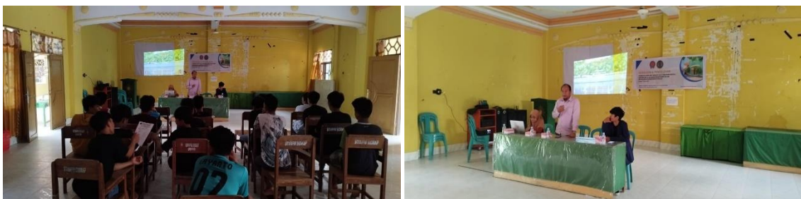
Gambar 2. Sosialisasi Pelaksanaan Kegiatan