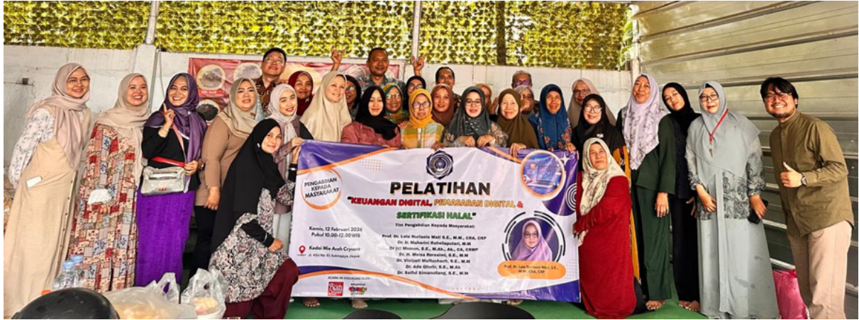
Gambar 5. Peserta Pelatihan Pengusaha UMK Depok

Diskusi dan tanya jawab dilakukan selama 3 jam, dan diakhiri dengan kegiatan pameran produk dan atau jasa yang dibawa oleh peserta saat acara pelatihan. Sebelum pemaparan materi dan pelatihan dilaksanakan, tim PKM memberikan pre-test kepada 30 peserta pelatihan terkait materi pengelolaan keuangan UMK melalui google form .