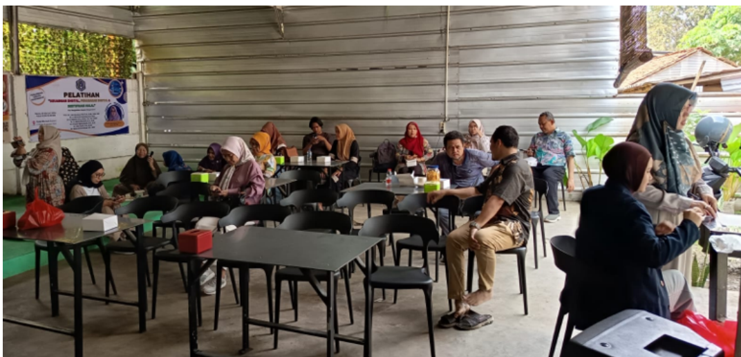
Gambar 2. Proses Registrasi Kegiatan PKM

Pelaksanaan pengabdian kepada masyarakat dilakukan di Kedai Mie Aceh Chrysant Depok yang dilaksanakan pada tanggal 12 Februari 2026. Kegiatan pelatihan ini dilakukan dari jam 09.00-14.00 WIB. Gambar 2 di bawah ini merupakan photo registrasi peserta pelatihan, setiap peserta mendapatkan kupon untuk ditukar dengan doorprize yang disiapkan oleh Tim PKM UTM Jakarta.