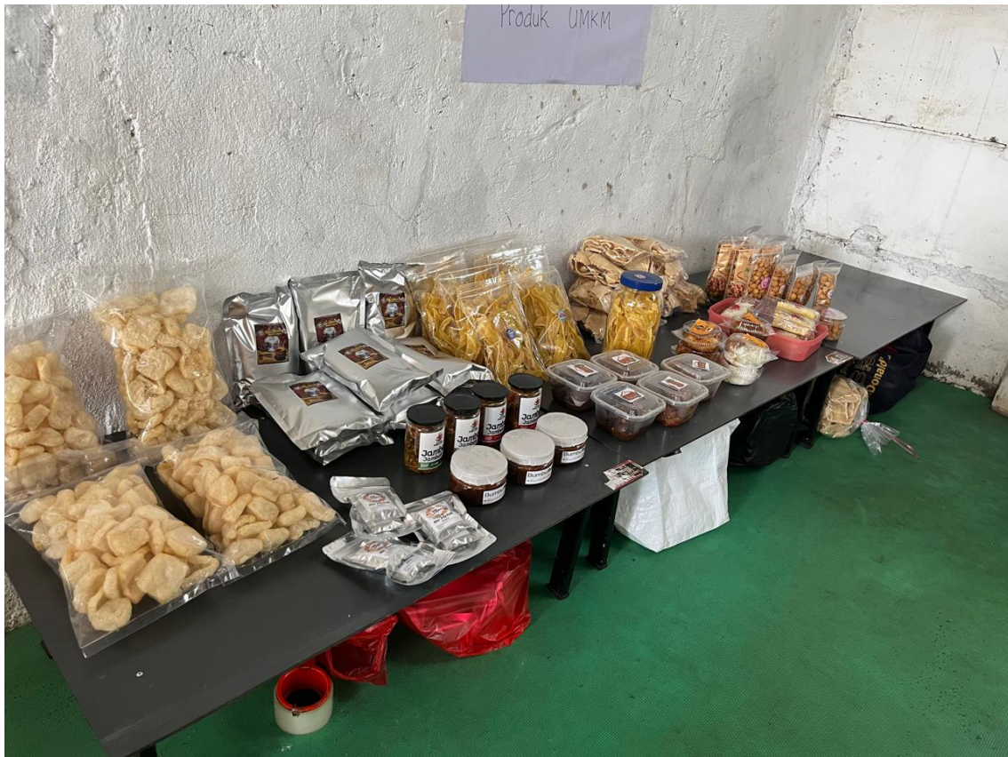
Gambar 7. Pameran Produk Buatan Peserta Pelatihan UMK Depok

Gambar 7 menggambarkan photo produk-produk buatan pengusaha UMK binaan Amanina Depok yang sebagian besar sudah memiliki sertifikasi halal.