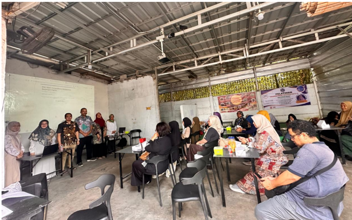
Gambar 4. Photo Kegiatan Pelatihan Literasi Keuangan Digital Pengusaha UMK Depok