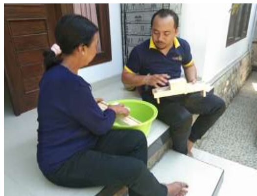
Gambar 7. Pelatihan pemotongan buah pisang menjadi bahan keripik pisang kepada Mitra

Selanjutnya, mitra diberikan pelatihan dan pendampingan untuk pengolahan buah pisang menjadi keripik. Kegiatan pelatihan ini diawali dengan diskusi tentang bagaimana pengolahan pisang menjadi bahan keripik pisang, lalu dilanjutkan dengan kegiatan pemotongan buah pisang menjadi bahan keripik pisang. Pelatihan pemotongan buah pisang menjadi keripik pisang dapat dilihat pada gambar 6. Disini, mitra mencoba menggunakan alat pemotong keripik bahan buah. Pemotongan dengan alat pemotong manual ini diperlukan pengaturan alat yang tepat agar ketebalan yang diperoleh bahan keripik sesuai dengan kebutuhan. Sebaiknya pemotongan buah pisang diatur agar tidak tebal, karena jika terlalu tebal akan mempengaruhi hasil jadi yang memungkinkan keripik menjadi terlalu tebal. Pemilihan buah pisang yang digunakan disini juga harus diperhatikan, karena buah yang dipilih adalah yang baru akan masak, sehingga hasil jadi keripik saat digoreng akan menjadi lebih renyah. Kedua hal ini sangat mempengaruhi hasil akhir dari keripik pisang ini.