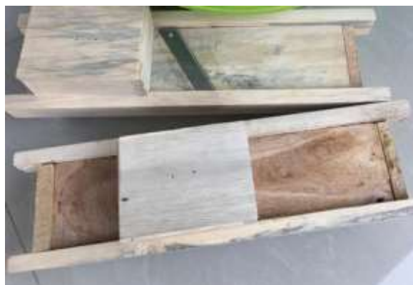
Gambar 3. Alat pemotong manual keripik berbahan buah yang diserahkan kepada mitra

Setelah dilakukan identifikasi permasalahan pada mitra, dilanjutkan dengan kegiatan solusi yang sudah diajukan kepada mitra kelompok tani Wana Giri. Diawali dengan pemberian alat beserta bahan yang digunakan oleh mitra untuk pengolahan bahan baku pisang menjadi keripik yang dapat digunakan mitra. Alat pemotong keripik bahan buah ini diberikan sebanyak 2 buah disertai juga bahan-bahan baku laennya yang nantinya dapat digunakan oleh mitra dalam pengolahan bahan baku buah pisang menjadi keripik. Pemberian alat ini sudah diberikan kepada mitra dan sudah diujicobakan dalam rangka pengenalan penggunaan alat pemotong keripik berbahan buah dan pendampingan proses pemotongan keripik berbahan buah pisang ini. Gambar 3 menunjukkan alat pemotong yang sudah diberikan kepada mitra.