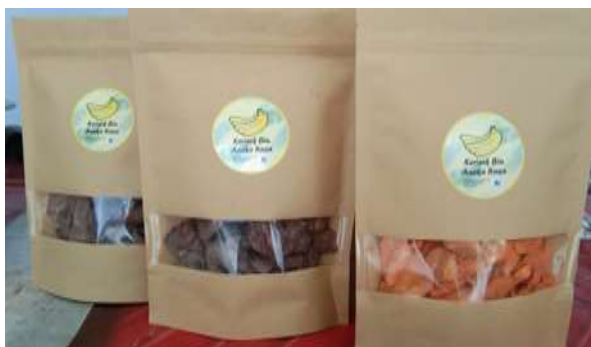
Gambar 11. Produk keripik pisang “keripik biu” varian rasa mitra Kelompok Tani Wana Giri

Kegiatan pengabdian PkM ini juga memerlukan evaluasi dalam memberikan sosialisasi serta pendampingan. Evaluasi PkM bersama mitra Kelompok tani Wana Giri ini dilakukan dengan teknik diskusi atau wawancara sehingga suasana menjadi lebih cair dan hal yang disampaikan oleh kedua pihak menjadi lebih santai tetapi tepat sasaran. Mitra merasa sangat senang mendapatkan ilmu baru dan alat yang dapat membantu meningkatkan nilai ekonomis produk pertanian mereka. Sekaligus mitra merasa sangat terbantu dengan go-online yang telah dilakukan oleh tim pelaksana yang mencakup website serta media sosial instagram untuk mitra. Kegiatan berjalan dengan baik, lancar dan dapat memberikan kebermanfaatn serta keberlanjutan yang bisa dilakukan diskusi via daring sehingga mitra tetap merasa didampingi untuk produk keripik pisang “keripik biu” varian rasa kelompok tani Wana Giri Br. Badingkayu, Pengeragoan, Jembrana.