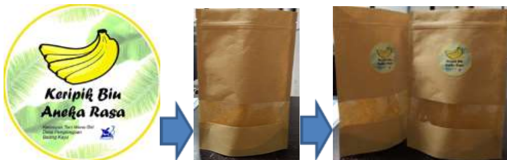
Gambar 9. Desain logo dan pengaplikasian logo pada kemasan paper kraft

Selanjutnya dilakukan desain logo dan prototipe kemasan yang akan digunakan oleh mitra. Logo didesain untuk memberikan awareness terhadap produk keripik pisang dari mitra. Kemasan yang digunakan juga ditentukan dengan berbahan paper kraft agar terlihat lebih kekinian. Desain logo yang digunakan untuk mitra dapat dilihat pada gambar 9. Setelah logo dicetak lalu diimplementasikan pada kemasan yang sudah disiapkan untuk mitra. Prototipe kemasan dengan logo yang sudah dicetak dapat dilihat pada gambar 9.