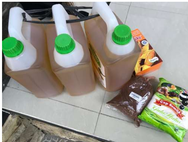
Gambar 5. Bahan pembuatan keripik pisang varian rasa

Selain alat, juga dilakukan pemberian bahan-bahan pembuatan keripik pisang kepada mitra. Bahan yang diberikan kepada mitra dapat dilihat pada gambar 5. Pemberian bahan untuk pembuatan keripik yang diserahkan kepada mitra ini mencakup seperti. Bahan baku berupa minyak untuk menggoreng bahan baku pisang, tepung maizena, gula bubuk serta bahan tepung varian rasa yang akan digunakan untuk pemberi rasa pada keripik pisang.