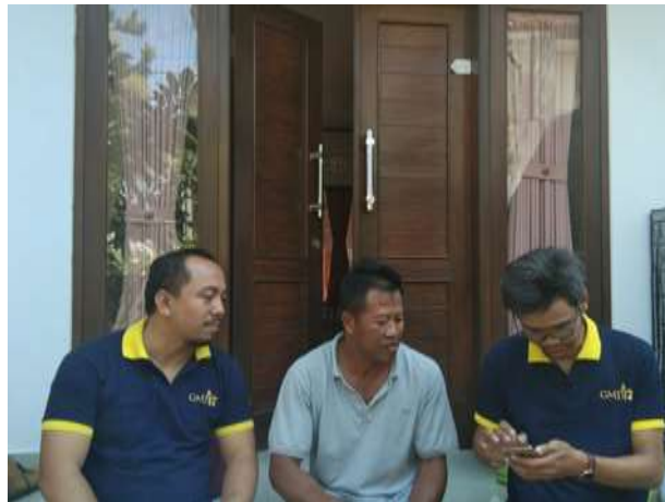
Gambar 2. Survei dan sosialisasi dengan mitra terkait kegiatan Pengabdian PKM

rendah, membuat kelompok tani ini kesusahan menaikkan harga jual dari buah pisang ini. Padahal produksi di kelompok tani ini bisa mencapai 1000-2500 per sekali panen dengan masa panens sekitar 1-2 minggu. Dilihat dari capaian produksi, ini merupakan masalah positif yang berarti merupakan masalah yang bisa dicarikan solusinya dengan meningkatkan nilai ekonomis buah pisang, dengan menghasilkan produk yang berbahan baku buah pisang. Dari permasalahan yang dihadapi mitra, dapat di jabarkan kembali permasalahan yang dihadapi beserta rancangan usulan solusi yang dimungkinkan diberikan kepada mitra.