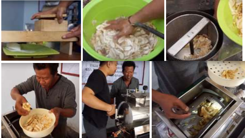
Gambar 8. Kegiatan pembuatan keripik pisang dengan menggunakan alat pemotong dan vacuum frying.

mencuci kembali hasil potongan buah pisang tersebut. Untuk menghilangkan air dan minyak setelah keripik digoreng menggunakan frying maka digunakan alat spinner. Alat spinner ini sudah menjadi 1 set dengan vacuum frying yang diberikan kepada mitra.