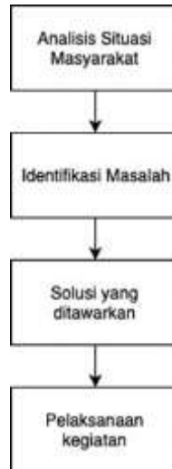
Gambar 1. Metode Pelaksanaan Pengabdian PKM