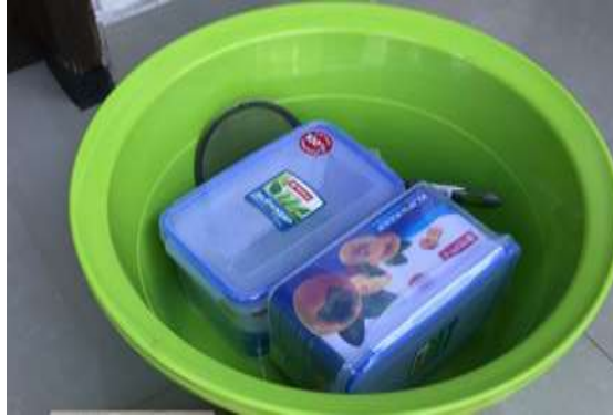
Gambar 4. Alat-alat untuk proses pembuatan keripik pisang dan kemasan paper kraft yang diserahkan kepada mitra.

plastik sebagai penyimpanan bahan tepung varian rasa, saringan tepung yang varian rasa serta paper kraft yang digunakan sebagai kemasan setelah keripik pisang diberi varian rasa yang diinginkan. Gambar 4 menunjukkan alat-alat yang diberikan kepada mitra kelompok tani Wana Giri.