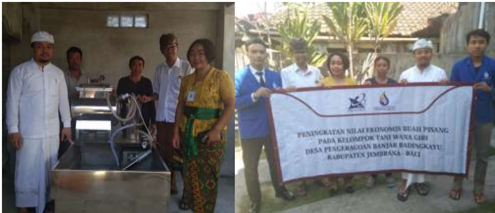
Gambar 6. Penyerahan alat vacuum frying kepada Mitra Pengabdian, tim pelaksana dan mahasiswa ITB STIKOM

Selanjutnya, mitra diberikan pelatihan dan pendampingan untuk pengolahan buah pisang menjadi keripik. Kegiatan pelatihan ini diawali dengan diskusi tentang bagaimana pengolahan pisang menjadi bahan keripik pisang, lalu dilanjutkan dengan kegiatan pemotongan buah pisang menjadi bahan keripik pisang. Pelatihan pemotongan buah pisang menjadi keripik pisang dapat dilihat pada gambar 6. Disini, mitra mencoba menggunakan alat pemotong keripik bahan buah. Pemotongan dengan alat pemotong manual ini diperlukan pengaturan alat yang tepat agar ketebalan yang diperoleh bahan keripik sesuai dengan kebutuhan. Sebaiknya pemotongan buah pisang diatur agar tidak tebal, karena jika terlalu tebal akan mempengaruhi hasil jadi yang memungkinkan keripik menjadi terlalu tebal. Pemilihan buah pisang yang digunakan disini juga harus diperhatikan, karena buah yang dipilih adalah yang baru akan masak, sehingga hasil jadi keripik saat digoreng akan menjadi lebih renyah. Kedua hal ini sangat mempengaruhi hasil akhir dari keripik pisang ini.