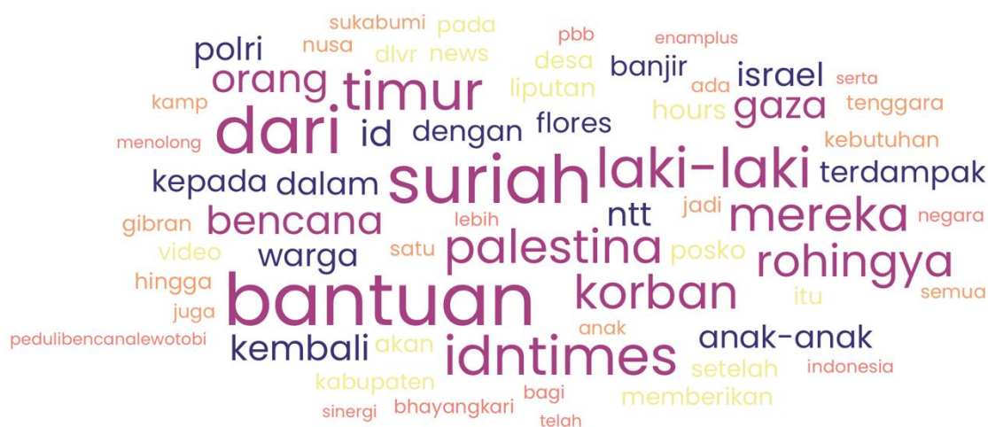
Gambar 2. WorldCloud Isu Pengungsi di Indonesia

Terlepas dari isu tersebut, dinamika wacana masyarakat di ranah media sosial memberikan interpretasi yang menarik. Berdasarkan analisis isi dari wacana terkait pengungsi di media sosial, terdapat pergeseran sentimen, khususnya pada periode akhir tahun 2023 hingga awal tahun 2024 dengan 4 bulan terakhir ini. Ketika isu terkait pengungsi Rohingya yang kembali mendarat di Aceh pada akhir 2023 lalu, unggahan masyarakat di media sosial cenderung memiliki sentimen yang negatif terhadap keberadaan pengungsi.